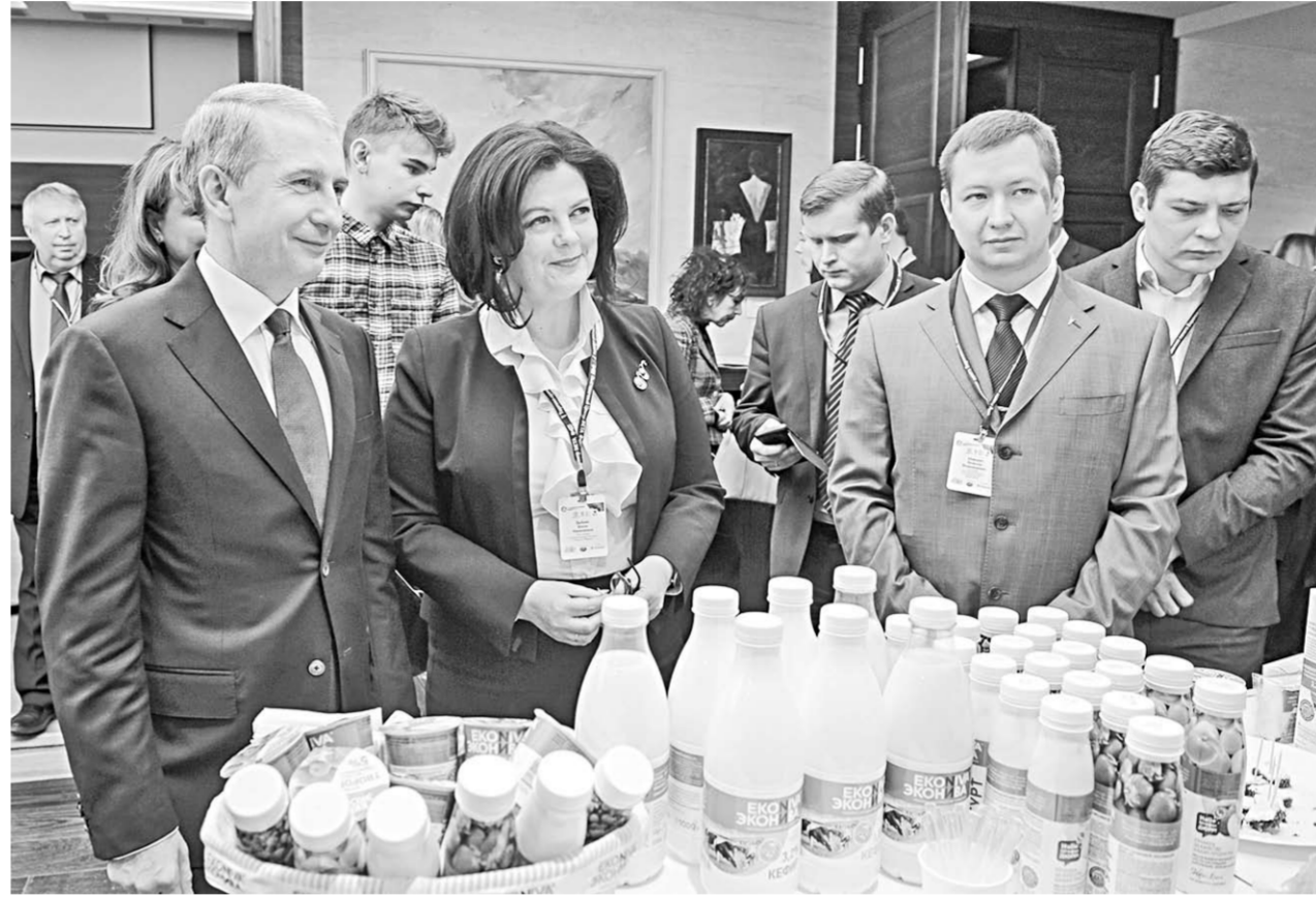
На выставке участники форума могли ознакомиться с лучшими образцами продукции местных товаропроизводителей.

Сергей Трухачёв отметил, что высокий потенциал агропромышленного комплекса Воронежской области реализуется максимально полно, обеспечивая продовольственную безопасность региона и страны в целом. – Сегодня Воронежская область занимает лидирующие позиции в Центральном федеральном округе по объёмам производства зерновых культур, сахарной свеклы, подсолнечника, развиваются перерабатывающая отрасль. Но запросы потребителей, конкуренция на внутреннем и внешнем рынках ставят перед нами новые вызовы, открывая при этом новые горизонты. В этой связи одним из неотъемлемых факторов успешного и эффективного развития сельского хозяйства является государственная поддержка, которая даёт дополнительный