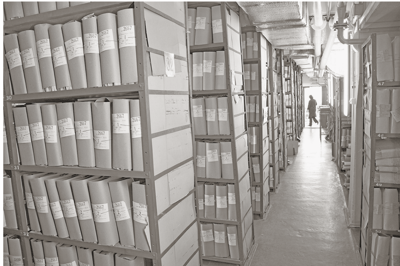
Общая площадь стеллажных полок с документами на бумажной основе – 16208 квадратных метров.

Здания на улице Плехановской Государственный архив Воронежской области размещается с 1967 года. Два года назад его сотрудники отметили полувековую дощину своего переезда.