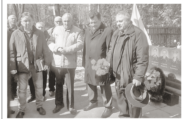
Ветераны ВМФ отдали дань памяти погибшим подводникам.

В воскресенье, 7 апреля, в областном центре отметили День памяти погибших подводников. Он был установлен приказом Главнокомандующего ВМФ РФ в память о трагической гибели 7 апреля 1989 года атомной подводной лодки Краснознаменного Северного флота К-278 «Комсомолец».