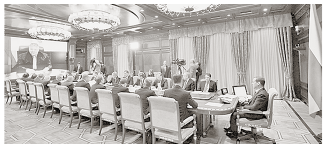
В ходе совещания губернатор Александр Гусев рассказал Дмитрию Медведеву о том, как воронежские аграрии подготовились к весенним работам.

– На совещании, которое было 18 марта, я поручил антимонопольной службе обеспечить мониторинг цен на минеральные удобрения и докладывать о ситуации ежемесячно. Если нужно – действовать в рамках антимонопольного законодательства, то есть применять меры анти-