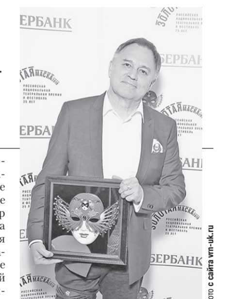
Заслуженный артист РФ Камилль Тукаев.

«КОММУНА» В ИНТЕРНЕТЕ http://www.kommuna.ru Тел: 2966 А-332 За месяц: 196155 TWITTER twitter.com/kommunanews FACEBOOK facebook.com/kommuna ВКонтакте vk.com/kommunanews ОДНОКЛАССНИК ok.com/kommunanews