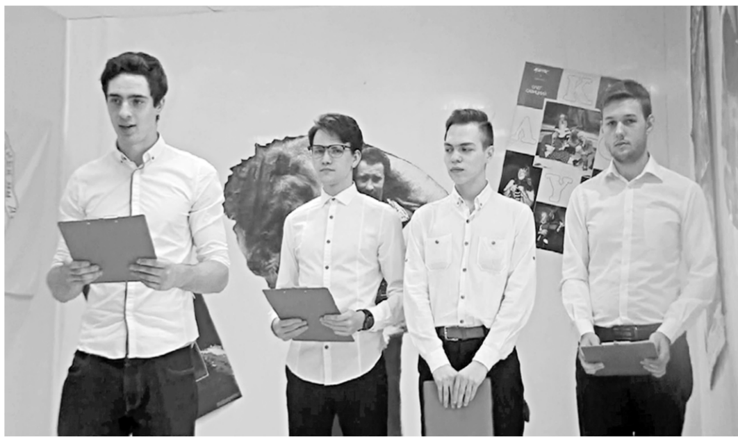
Студенты ВГИИ выступают в Центре циркового искусства.

Борис Бирюков владеет истинные энциклопедическими знаниями по истории цирка, был знаком со многими мастерами арены. И это неудивительно — ведь он сам частица этой большой истории.