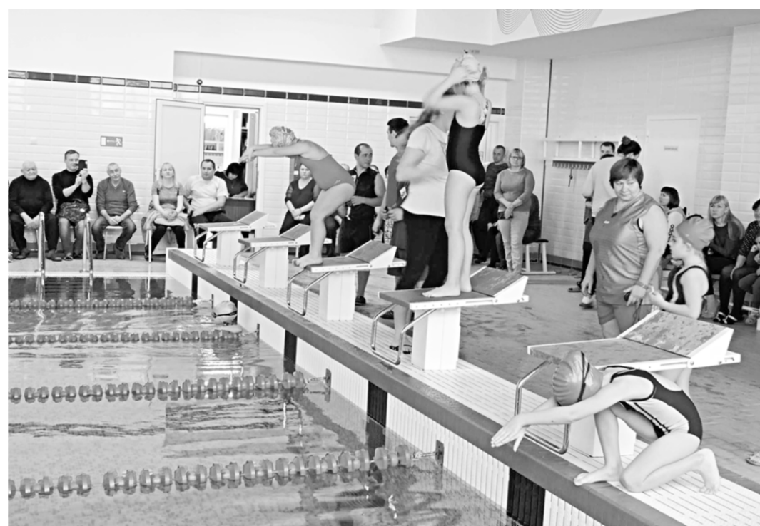
На голубых дорожках бассейна проходят соревнования «Весёлые старты».