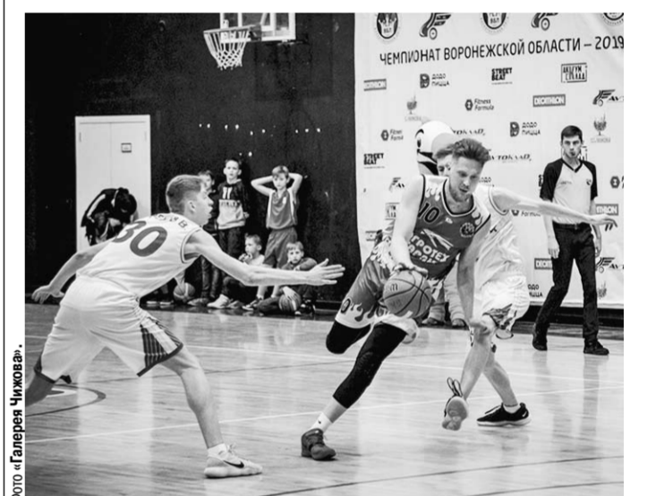
Лучшие игроки ВБЛ показали высокий уровень подготовки.

«Матч звёзд ВБЛ», прошедший в спорткомплексе института физкультуры, вызвал немалый интерес у любителей баскетбола.