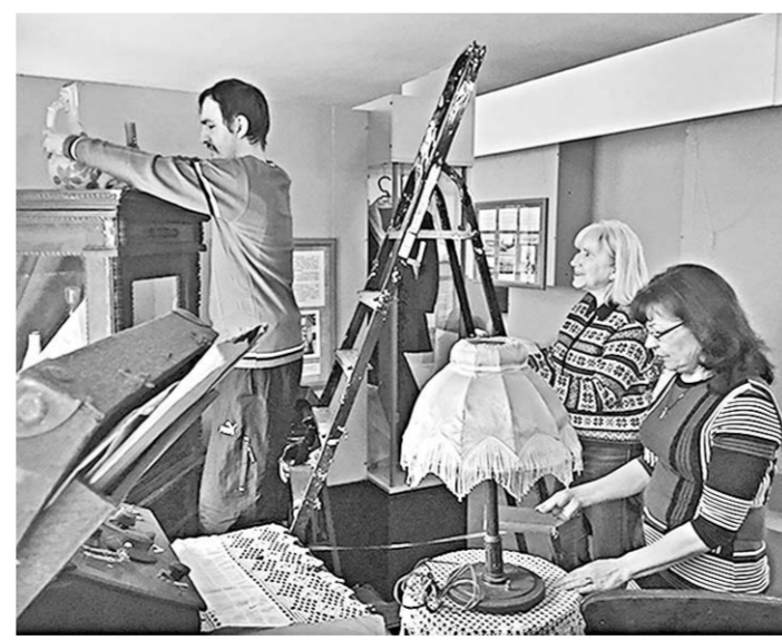
Экспозицию сотрудники обновят весьма серьёзно.

Новинкой станет большая платформа в середине зала. Планируется вокруг неё возвести макет, который будет стилизован под ФД-20 с окнами по краям, в которых и расположится информация. Размер – практически на длину зала. Здесь-то и разместят основные сведения о железной дороге. Она, как видим, играет важную роль в истории райцентра.