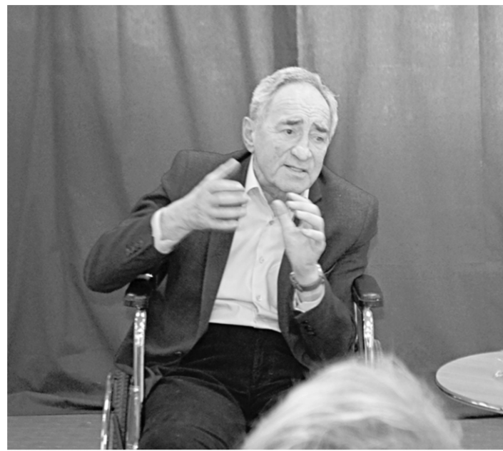
Народный артист РСФСР Борис Бирюков.

Культура | Накануне Всемирного дня цирка, который отмечается 20 апреля, в Воронежском центре циркового искусства состоялся творческий вечер народного артиста РСФСР, выдающегося дрессировщика Бориса Бирюкова