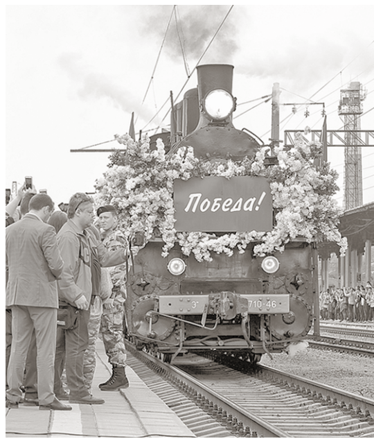
Волнующий момент прибытия легендарного ретро-состава.

Событие | Встреча «Поезда Победы» на вокзале «Воронеж-1», вызвавшая искренний интерес горожан (на перроне было не протолкнуться), стала финальным аккордом патриотической акции, которая прошла в нескольких областях Центрального Черноземья