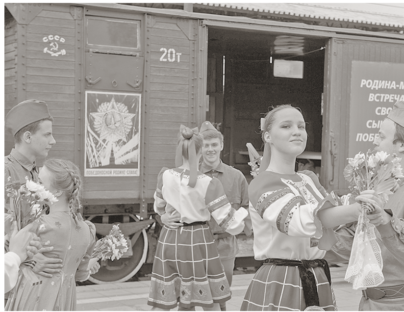
Воинов-победителей встречают девушки. Звучит музыка, и пары кружатся в вальсе.

На перроне главного вокзала Воронежа в субботу, 27 апреля, посмотреть прибытие «Поезда Победы» собрались сотни горожан, многие пришли с детьми. Волнующие минуты – словно окунаешься в атмосферу победного 45-го... Вдалеке раздаются протяжные гудки, показывается паровоз с теплушками. Сердце стучит, наворачивается слеза на глазах. Словами невозможно передать всю полноту ощущений, нужно видеть своими глазами! Даже взрослому тяжело справиться с волнением.