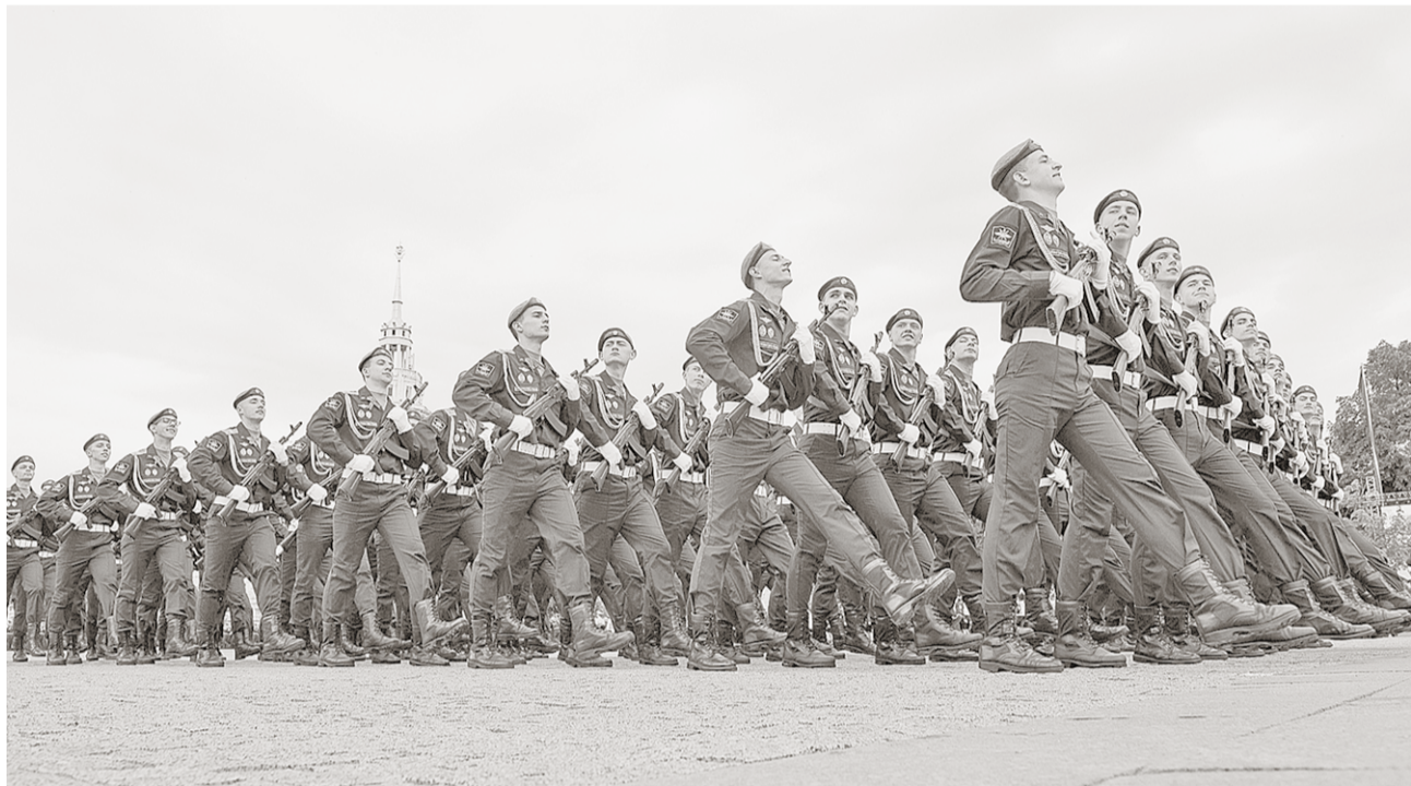
Захватывающая, впечатляющая и волнующая часть парада – прохождение воинских колонн.

Общество | Девятого мая в Воронеже на площади Ленина прошёл военный парад, приуроченный к 74-летию Победы в Великой Отечественной войне