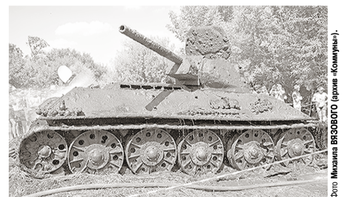
Таким танк был, когда его подняли со дна реки Дон.

В военно-патриотическом парке «Патриот» Московской области представлен танк Т-34-76, поднятый со дна реки Дон в районе урочища Украинская Бульков Воронежской области.