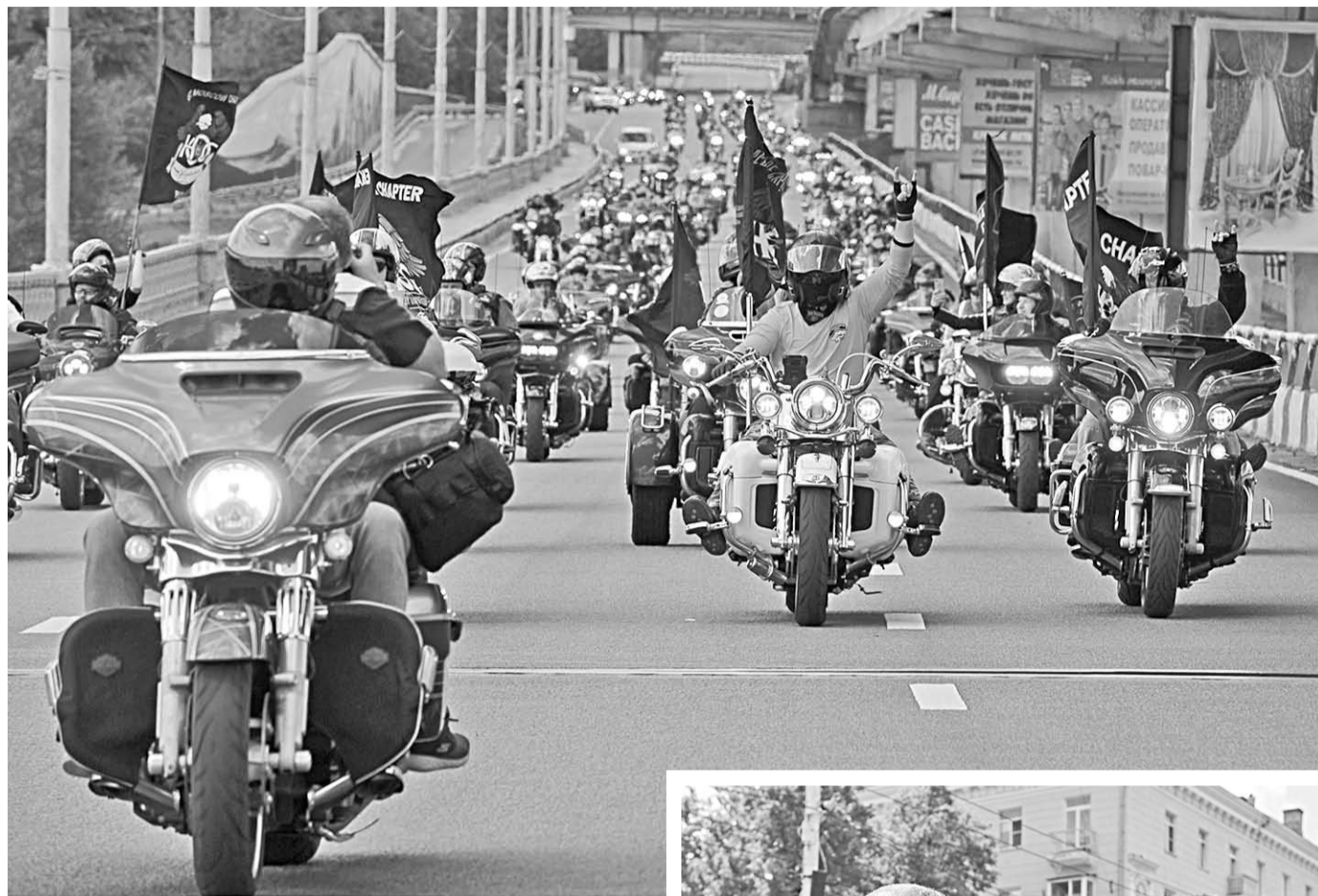
Сверкающая хромом колонна двинулась на Адмиралтейскую площадь.