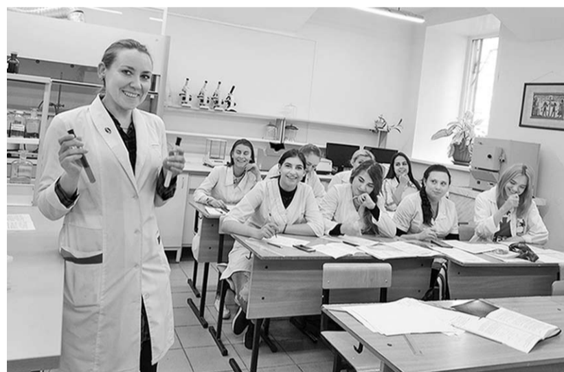
На занятиях по фармакогнозии в студенческой группе.