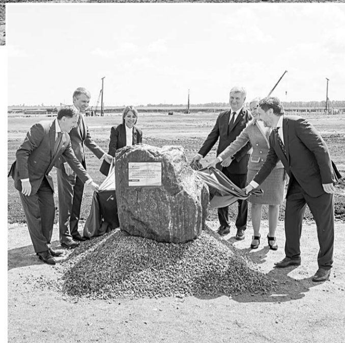
Закладка камня в честь начала строительства мясолабодной территории опережающего социально-экономического развития «Павловск».