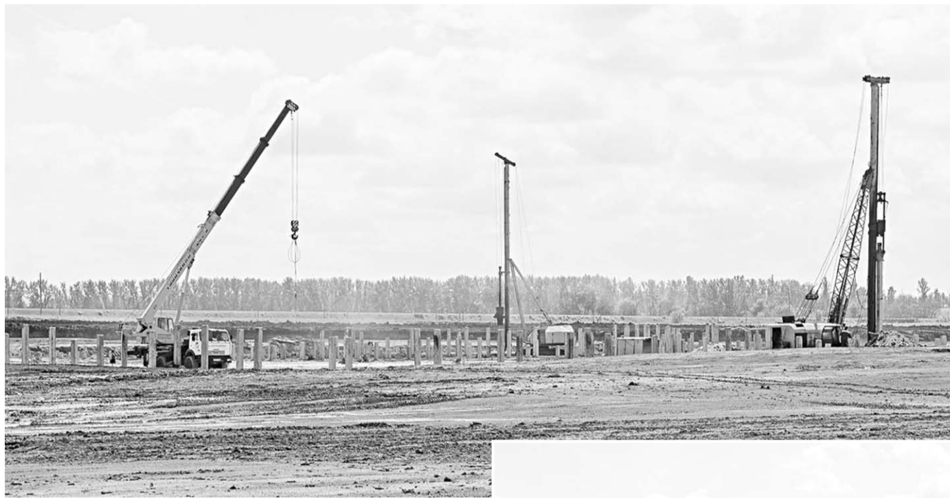
Через два года на этой площадке появится современный мясоперерабатывающий комбинат.

– Для моногорода Павловск объект очень важен. «Агроко» фактически становится ключевым резидентом территории опережающего развития. Это будет хороший пример, которому последуют другие инвесторы. И еще две важные задачи мы решаем с компанией «Агроко». Первая – это замещение государственных инвестиций в инфраструктурные объекты, которые в последние годы достаточно много на территории области осуществлялись. Наша задача – заместить их коммерческими инвестициями, не только сохранив существующий объем общих инве-