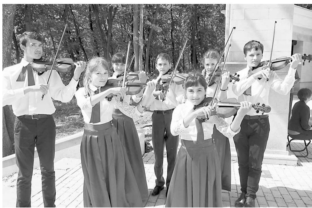
Юные скрипачи из села Ярки.