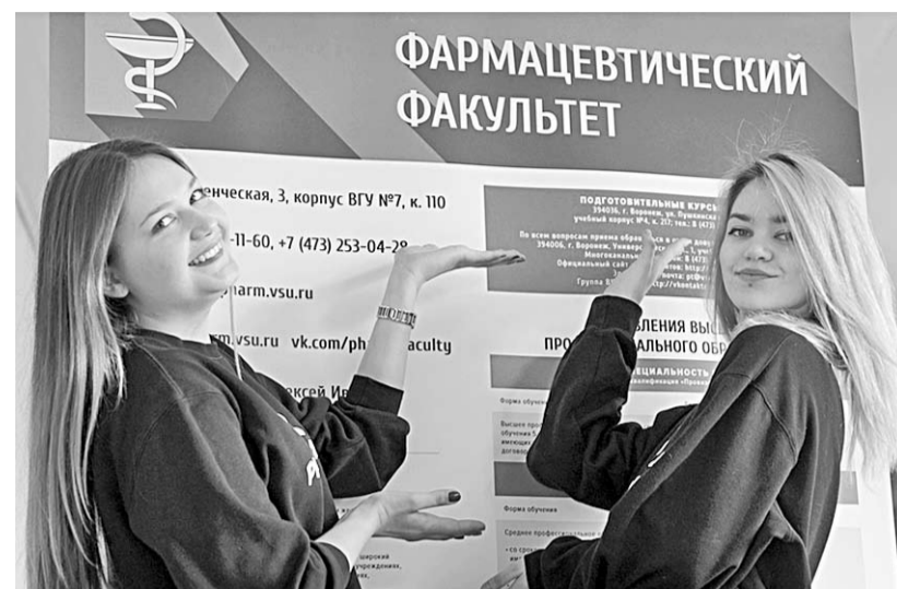
На фармацевтическом факультете ждут активных и целеустремлённых.

А чуть ранее в рамках академической мобильности по программе