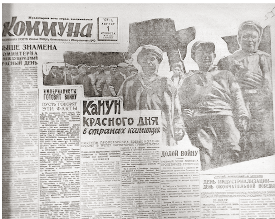
Так выглядела «Коммуна» в начале 30-х годов.

Возьмём для примера всего лишь один номер «Коммуны» – от 28 октября 1931 года. В нём содержится большая подборка оперативной информации под общей шапкой «Где перестроена работа, там темпы идут вверх». Вот выдержка из нескольких сообщений. «Анна (26 октября). По инициативе «Коммуны» на маслозаводе и винозаводе созданы бригады содействия хлебозаготовкам; пленум Курлакского сельсовета совместно с председателями колхозов вынес решение превратить день первого ноября в силовую поточку красных обозов встречного плана имени газеты «Коммуна». «Мордово (27 октября). В районе находится под угрозой срыва выполнения плана хлебозаготовок, в связи с чем бригада «Коммуны» выезжает в отчаившие сельсоветы и берёт