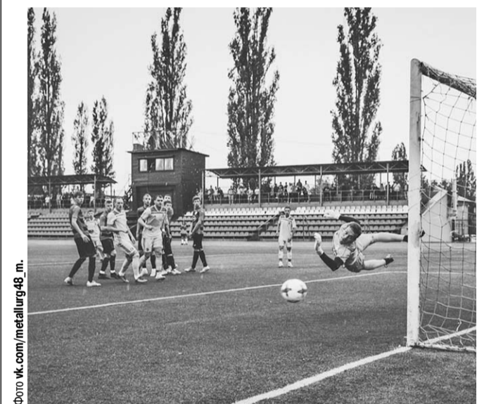
«Металлург-М» – «Локомотив». Опасный момент у ворот хозяев поля.

А поединку «Металлург-ОЭМК» (Старый Оскол) – «Спартак» (Россошь) принёс победу «сталеварам» со счётом 4:1.