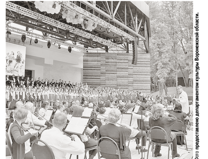
По установившейся традиции в концерте в Зелёном театре участвуют хоры и симфонический оркестр.

В Воронеже отметят День славянской письменности и культуры