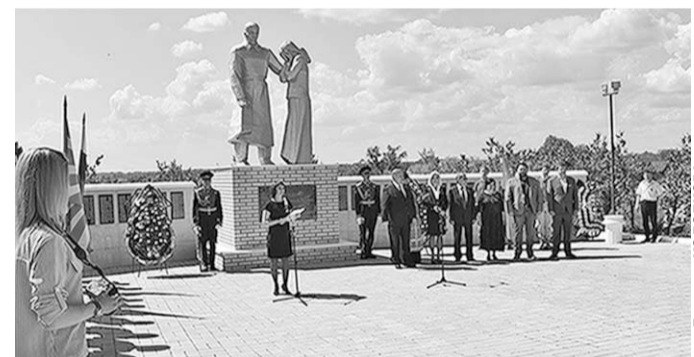
Торжественный митинг у мемориала.

В этот раз земле были преданы останки 96 красноармейцев. В торжестве приняли участие военнослужащие Воронежского гарнизона Запад-