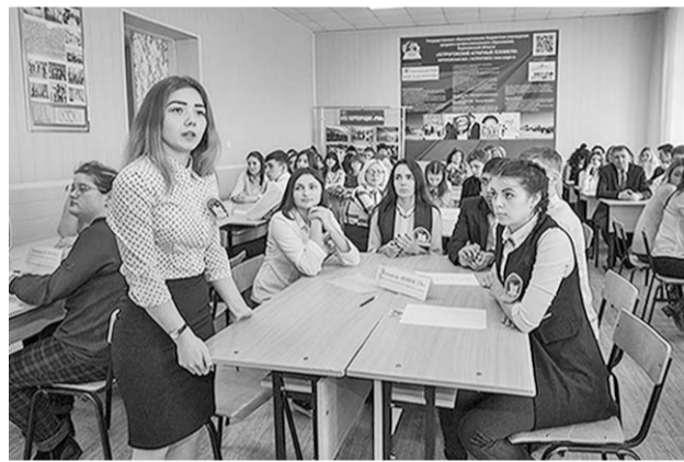
История комсомола оказалась близка молодым острогожцам.

Накануне 100-летнего юбилея районной комсомольской организации в Острогожском многопрофильном техникуме прошла познавательная викторина «Как я знаю историю комсомола?».