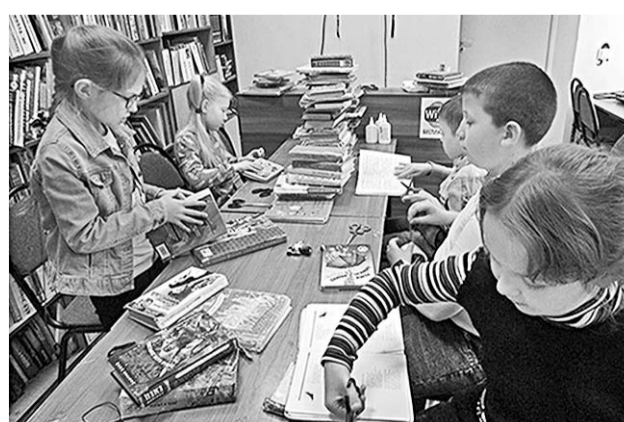
Дети освоили основы переплётного мастерства.

Интересные и познавательные мероприятия прошли сразу в обеих острогожских библиотеках.