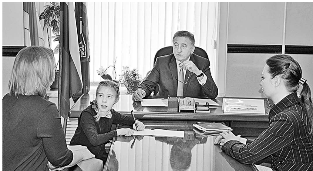
Сергей Лукин ведёт приём граждан.

Общество | Сенатор Сергей Лукин на личном приёме граждан в Воронеже на площадке региональной Общественной приёмной лидера партии «Единая Россия» заявил: «Наша задача – найти эффективное решение проблем, с которыми обращаются жители»