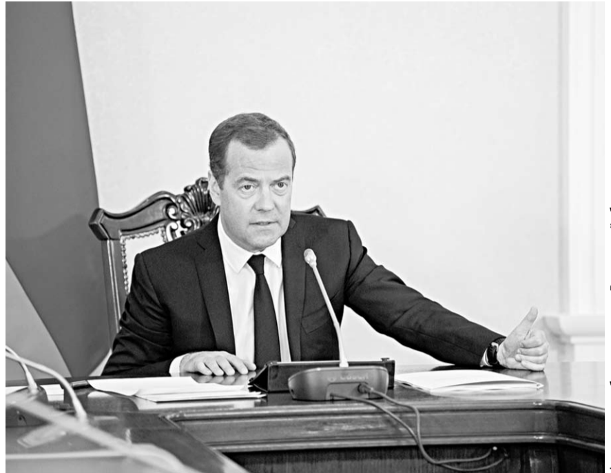
По мнению Дмитрия Медведева, государственную программу надо синхронизировать с национальными проектами и Стратегией пространственного развития.