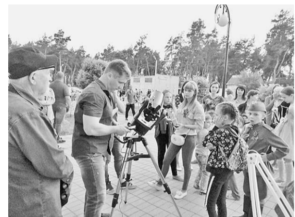
Школьники стали главными участниками астрономической акции.

Молодёжный центр Россоши организовал вечер трюарной астрономии.