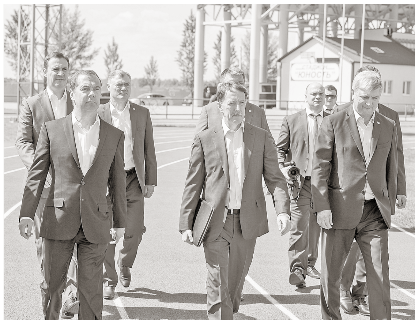
В Воронежской области немало хороших примеров комплексного развития сельских территорий. И один из них – это Рамонский муниципальный район, который посетил премьер-министр Дмитрий Медведев.

В селе Нелжа премьер-министр побывал на территории животноводческого комплекса ГК «Заречное». Сельскохозяйственное предприятие «Заречное» создано в 2011 году, когда на территории Воронежской области началась