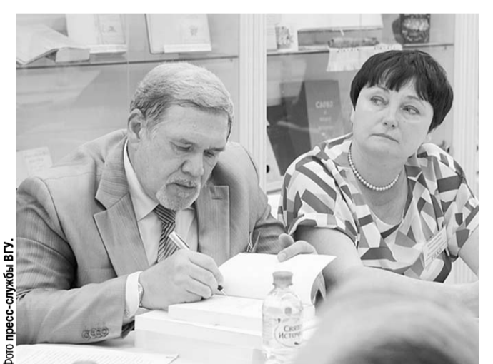
Друзьям – книги с дарственной надписью.

Вчера, в канун Дня славянской письменности и культуры, в Воронежском государственном университете открылась международная конференция «ФИЛКО: филология, культура, образование».