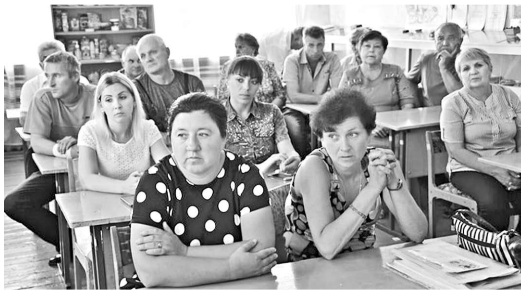
Встреча с депутатом педагогам прибавила оптимизма.

Требования учителей поддержали и родители студентов: «Куда нам отправлять своих детей? У нас училище