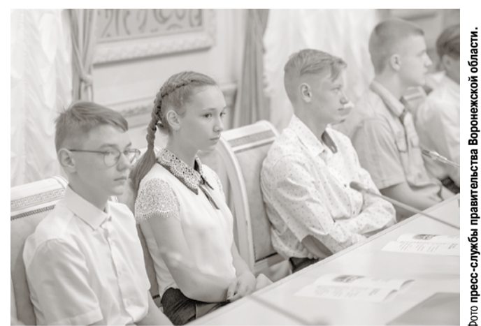
Эти ребята получили паспорта граждан РФ из рук главы региона.