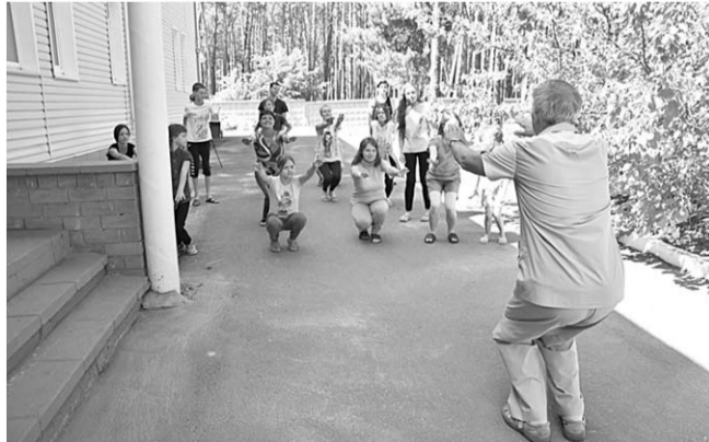
Физкультуринутка детям пришлась по душе.

Медики совместно с коллегами детского санатория для детей с родителями провели акцию «Здоровые дети – здоровая страна».