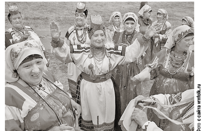
На фестивале прозвучали исконно воронежские песни в исполнении фольклорных ансамблей.

В Верхнемамонском районе прошёл межрегиональный певческий фестиваль «Песни над Доном».