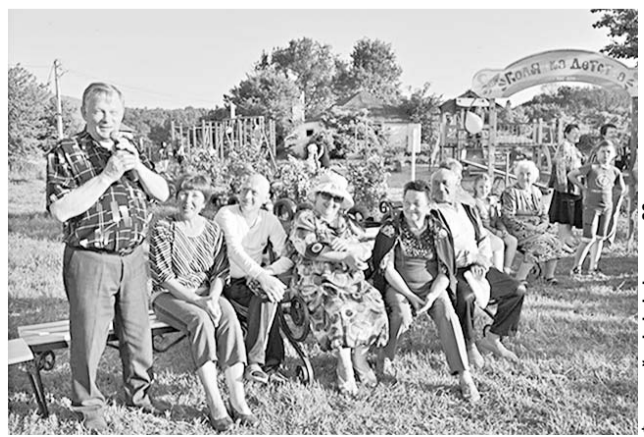
На Дне соседей царил хорошее настроение.

В Хохольском районе прошёл День соседей.