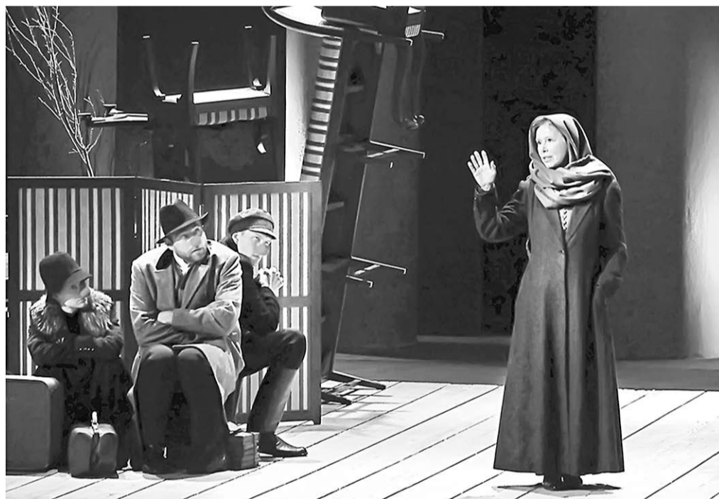
Сцена из спектакля «Русский роман».

Очень сильное впечатление оставляет финал – смерть Толстого на станции Астанова. Софью Андреевну не пустили в дом, не дали проститься. Чертоква, стоя у смертного одра, силится