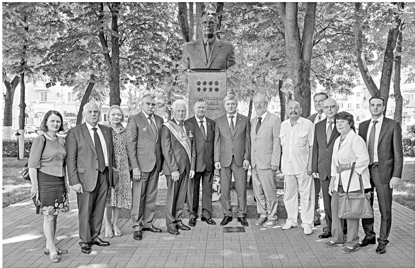
Александр Гусев вместе с представителями воронежского землячества возложил цветы к памятнику Виталию Воротникову.

Среди них – орден Мужества, почётные знаки правительства Воронежской области «Благодарность от земли Воронежской», «За добросовестный труд и профессионализм», «За добросовестную службу Воронежской области», медаль «За труды во благо земли Воронежской» и знаки отличия «За заслуги перед Воронежской областью». Кроме того, были присвоены почётные звания в сферах образования, здравоохранения, строительства