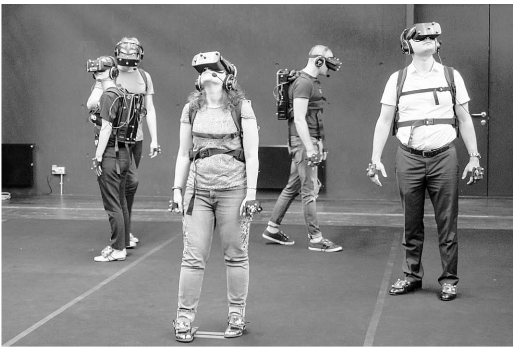
Чтобы оказаться внутри спектакля, достаточно надеть специальный костюм.

Окружающий пейзаж всё время меняется. В виртуальное действие включаются актёры-танцоры. Они заполняют всё пространство, показывая движения, которые можно за ними повторять, перемещаясь, миможая. Всё это – красивые иллюзии. Однако за 20 минут виртуального спектакля можно научиться взаимодействовать с героями, танцуя вместе с ними. Не забываем, что постановщик представления – хореограф, поэтому пластика, красота танца – главная тема миниспектакля. Жилья Жобен мастерски превращает компьютерных героев и зритель-участников в объединённый балетный класс. Важно только не ошибиться, кто из персонажей такой же, как ты, аватар, а кто – компьютерный призрак, к которому невозможно прикоснуться.