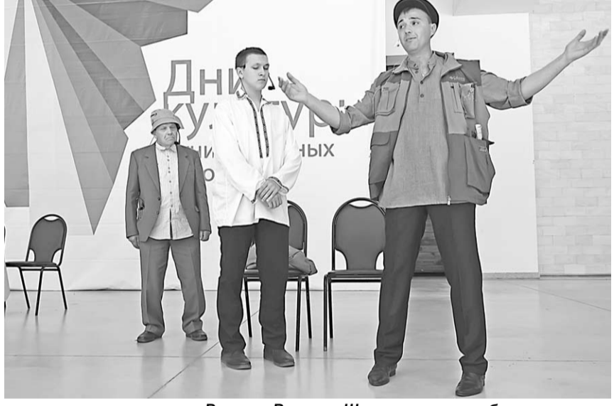
Рассказ Василия Шукшина ожил в образах и лицах.