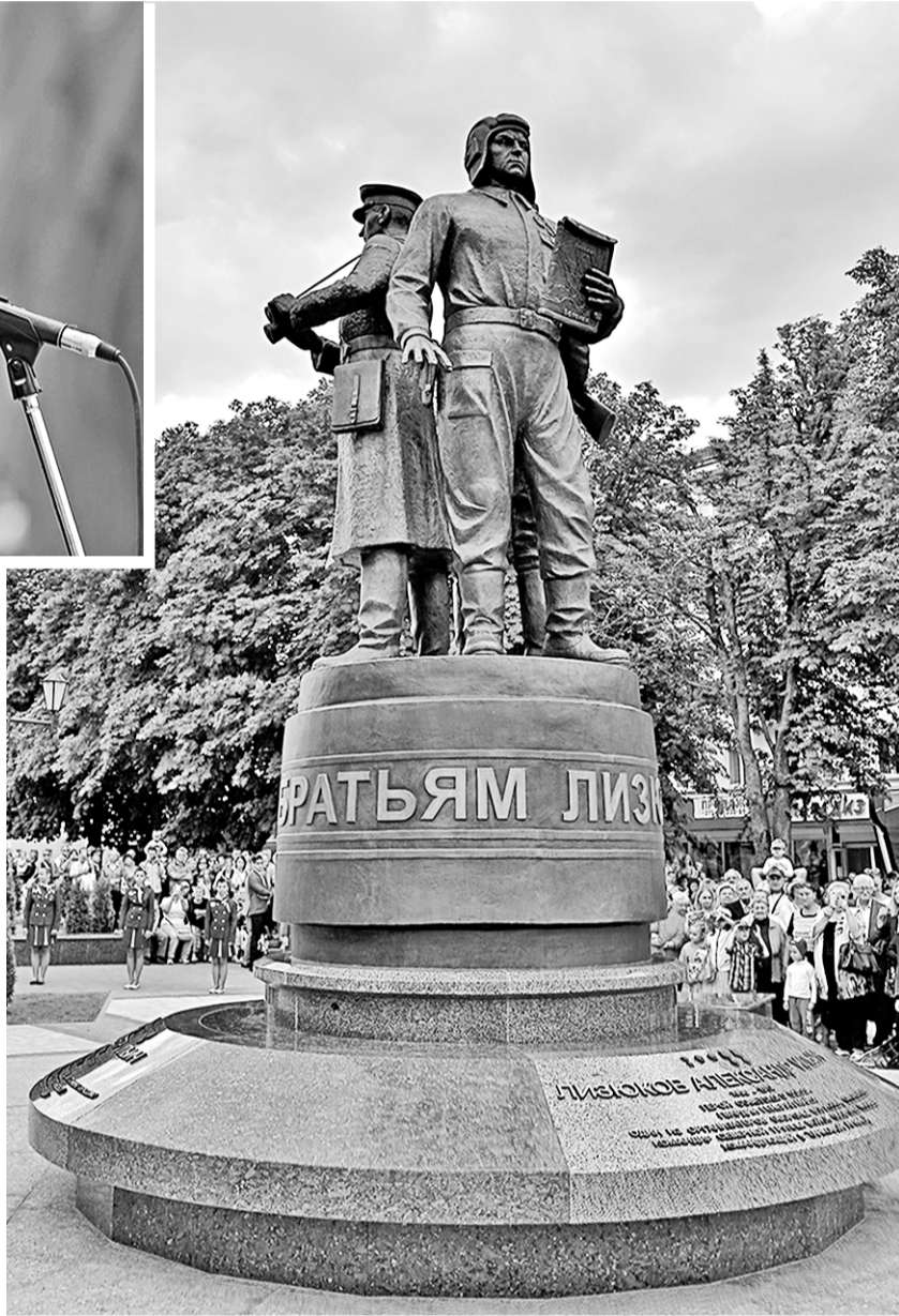
Монумент братьям Лизюковым.

Прежде всего это документальная история героической биографии братьев, родившихся на гомельской земле. Реальных, настоящих, не придуманных. Для них не было ничего дороже Родины, как и для всех тех,