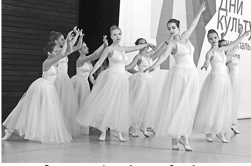
Танцует хореографический коллектив Детской школы искусств.

Зашёл на почту – купил «Коммуну» Если рядом с вашим домом нет газетного киоска или его закрыли, не отчаивайтесь. Загляните в ближайшее почтовое отделение и в нём вы найдёте экземпляры «Коммуны», предназначенные для розничной продажи. Но самый надёжный способ не пропустить ни одного номера – это оформить полугодовую подписку.