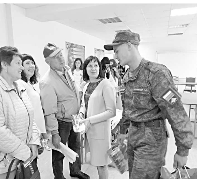
Встреча членов делегации из Кантемировки с молодыми воинами-земляками.

Многие помнят, как в советское время тесна была связь местных органов власти с юношами, проходившими службу в рядах Советской армии. Официальные делегации приезжали на присягу, передавали письма. Всем селом читали письма военнослужащих и писали им ответы. Занесли на доску почета благодарности