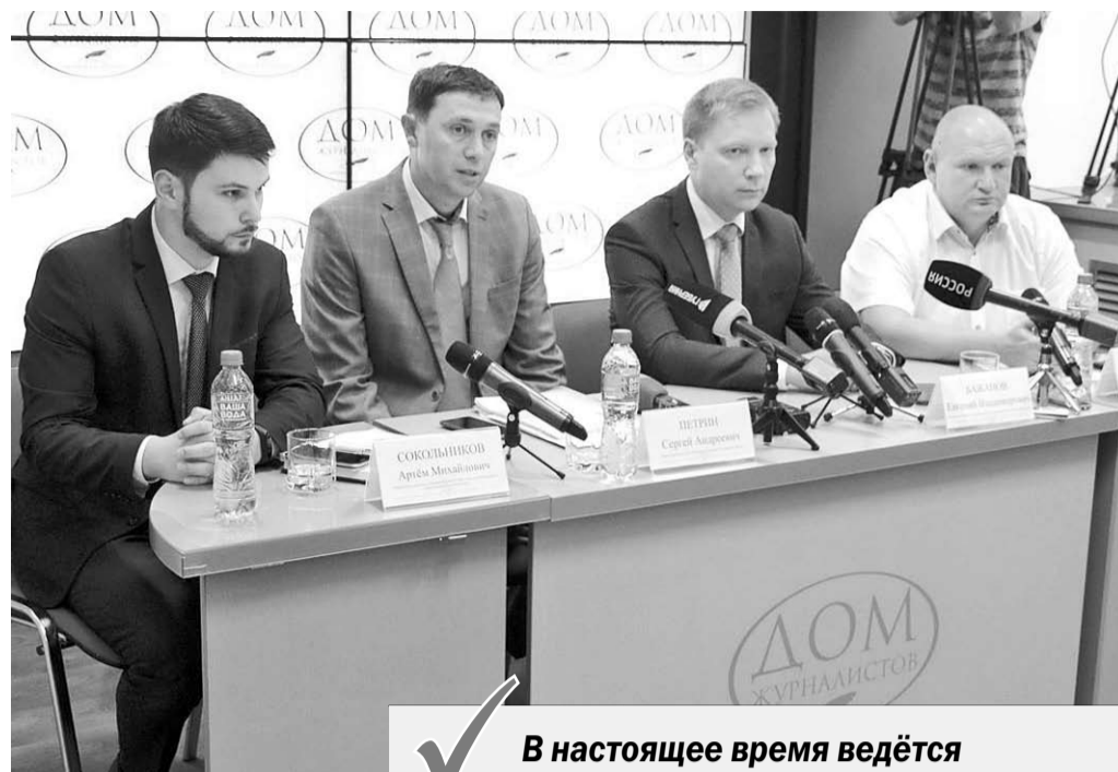
Во время пресс-конференции.

– Мы не занимаемся гаданием и не занимаемся волюнтаристскими решениями.