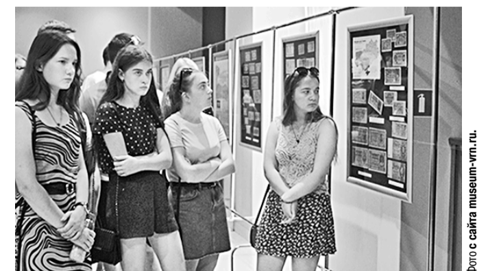
Посетители осматривают экспозицию выставки.

http://www.kommuna.ru Вчера 1693 А.417 За месяц 6974 TWITTER twitter.com/kommunanews FACEBOOK facebook.com/kommuna VKONTAKTE vk.com/kommunanews ОДНОКЛАССНИКИ ok.com/kommunanews