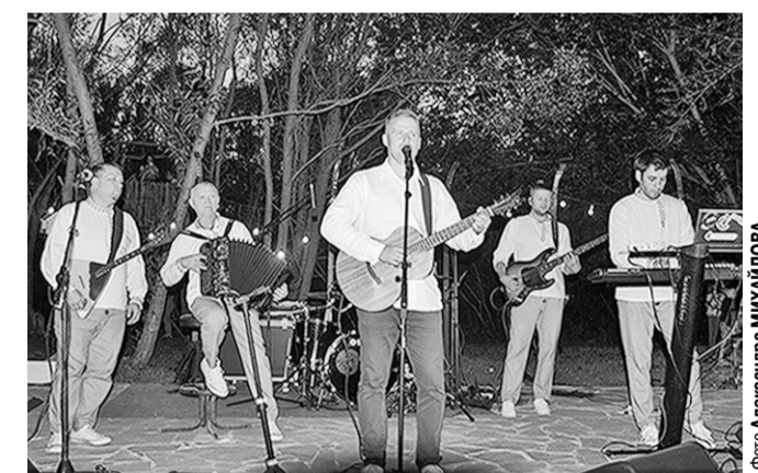
Под вечерним небом Лозового выступает «Ярилов зной».

Сотни жителей старинного верхнеамонского села Лозового, а также гости из соседних населённых пунктов, из Верхнего Мамона, Павловка и даже из Воронежа пришли и приехали на прошедший здесь воскресным вечером праздник, посвящённый Дню семьи, любви и верности.