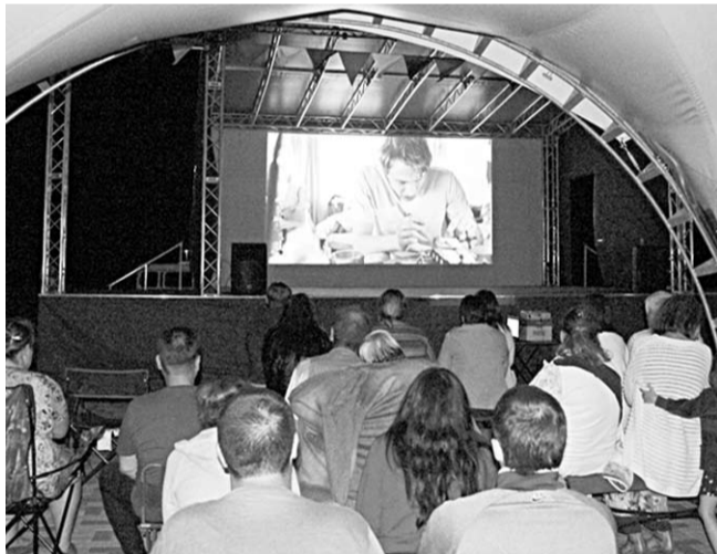
Улицы стала кинозалом.

Фестиваль проводится в России с 2014 года, когда команда молодых ребят из Владивостока решила создать по-настоящему народный кинопоказ. Этим летом он объединил свыше тысячи городов и населённых пунктов, 700 тысяч зрителей на 2500 площадках и станет самым массовым просмотром кино под открытым небом в мире. В Воронежской области координатором Фестиваля выступает департамент культуры и Воронежский областной Центр народного творчества и кино.