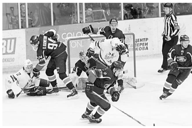
До открытия нового хоккейного сезона осталось менее двух месяцев.

Работу на льду и в тренажёрном зале дополняют два контрольных матча с ХК «Тамбов» – в Мичуринске и Тамбове. Также руководством «Бурана» запланировано участие команды в двух предсезонных турнирах – в Тамбове и Пензе.