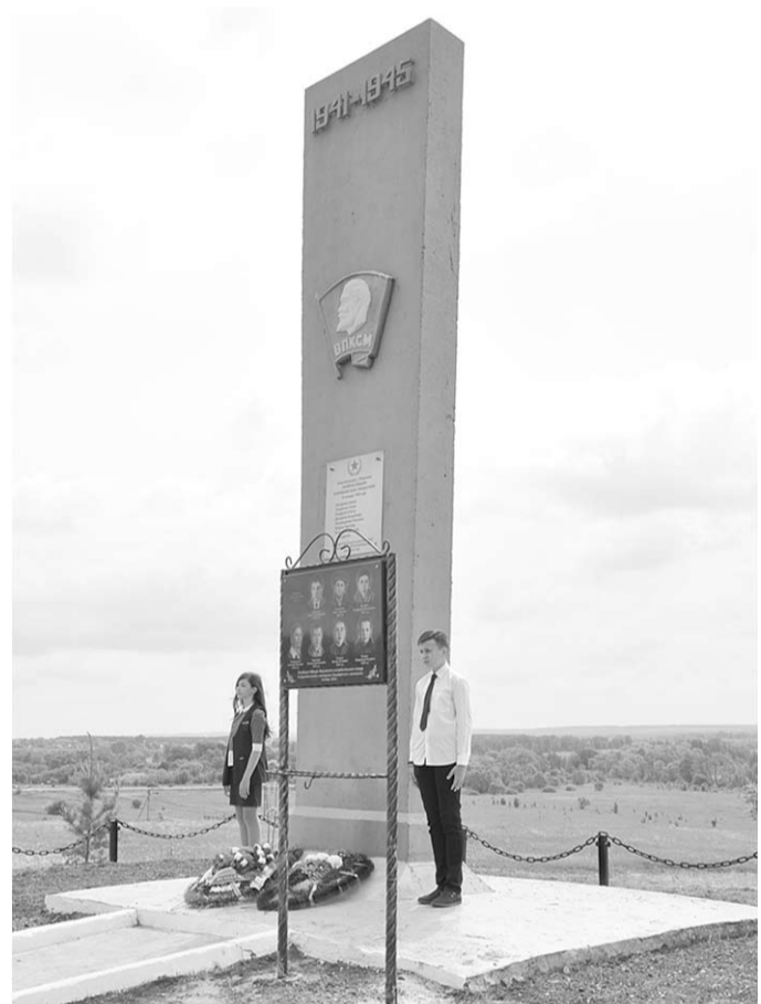
Мемориал и памятная доска с фотографиями бойцов истребительного отряда Марьевки.

Во время подготовки к 30-летию Великой Победы по инициативе заместителя директора профтехучилища №4 (ныне агротехнический