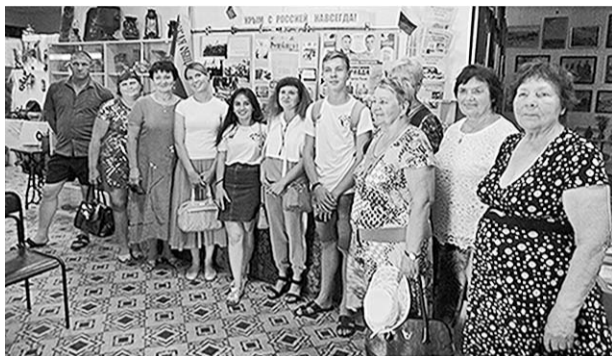
Группа кантемировцев в музее Джанкой.

Большая группа кантемировцев совершила экскурсионно-туристическую поездку в Джанкойский район Республики Крым.