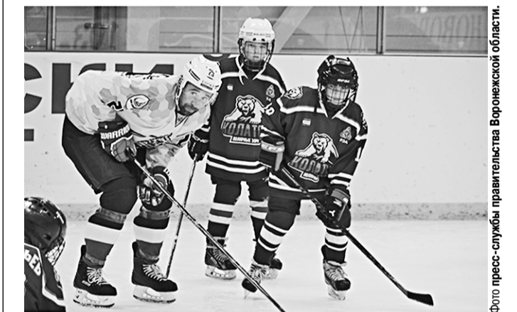
Данис Зарипов с нововоронежскими юными хоккеистами.

Известный российский спортсмен Данис Зарипов, много лет выступавший за казанский «Ак Барс», провёл мастер-класс на ледовой арене «Осталыная» в Нововоронеже. Трёхкратный чемпион мира привёз в город атомщиков тренеров своего хоккейного центра «Победный бросок».