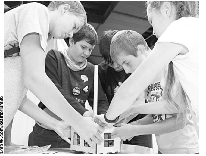
Ребята заняты моделированием.

В Воронежском детском технопарке «Кванториум» прошла виртуальная смена.