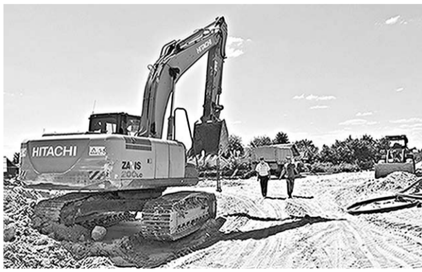
Идет строительство спорткомплекса.

На месте старой Митрофановской школы активно ведутся строительные работы. Здесь к 2020 году возведут спортивный комплекс.