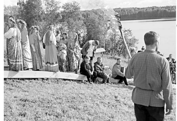
Гости тепло встретили земля Русского севера.

Как правильно создавать и развивать Клубы заповедных друзей, как силой клуба решать задачи заповедника, как заинтересовать молодое поколение природоохранной тематикой —