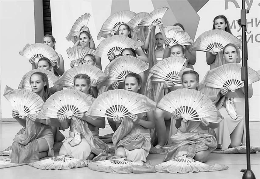
Танец «Море» представил ансамбль «Маркетрия».