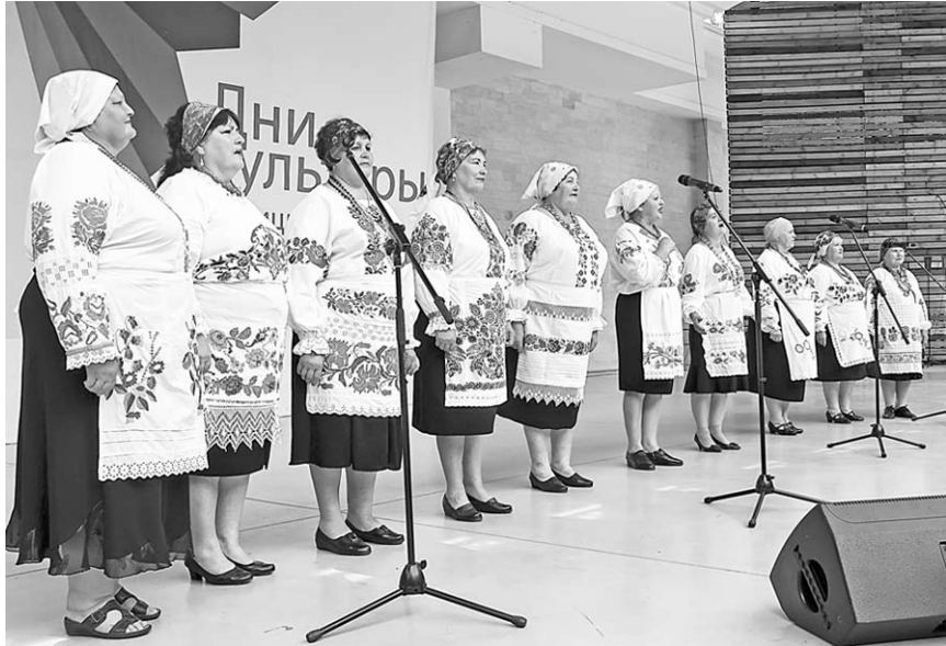
Поёт «Крестьянский хор».