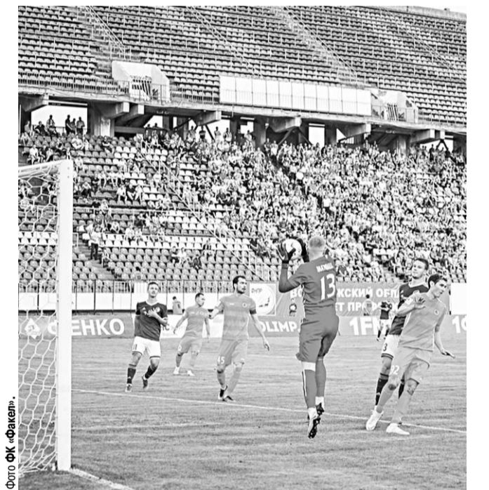
ФК «Факел» продолжит выступления в первенстве ФНЛ на поле Центрального стадиона профсоюзников.

Сертификат второй категории даёт право проводить на стадионе календарные игры первенства России по футболу среди команд клубов ФНЛ и Кубка России. Центральный стадион профсоюзников является единственной ареной в Воронежской области, соответствующей требованиям регламента Футбольной национальной лиги и «Стандарта РФС» соответствующей категории.