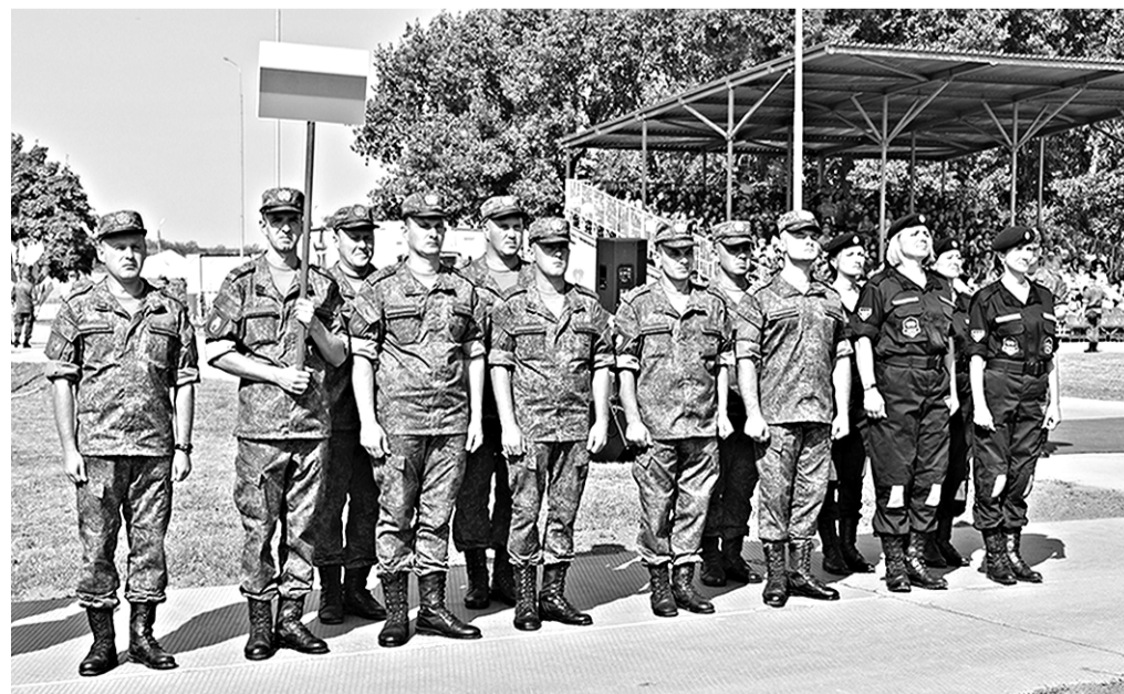
Мужская и женская сборные России.

российские водители за рулём «КамАЗов», «УАЗов» и «Фордов» продемонстрировали свои навыки вождения: пары на колесах синхронно отгибали конусы, кружились в хороводе,