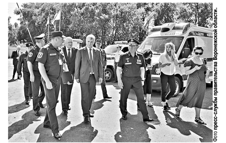
Александр Журавлёв совместно с губернатором Александром Гусевым подвели итоги учения.

Губернатор Александр Гусев и командующий войсками Западного военного округа (ЗВО) генерал-полковник Александр Журавлёв проинспектировали ход мобилизационного учения на аэродроме Балтимор.