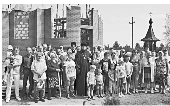
Жители посёлка с Владыкой после освящения закладного камня будущей церкви.

Епископ Борисоглебский и Бутурлиновский Сергей совершил чин освящения закладного камня в основание будущего храма во имя святой великомученицы Варвары в посёлке Варварино Новохоперского района.