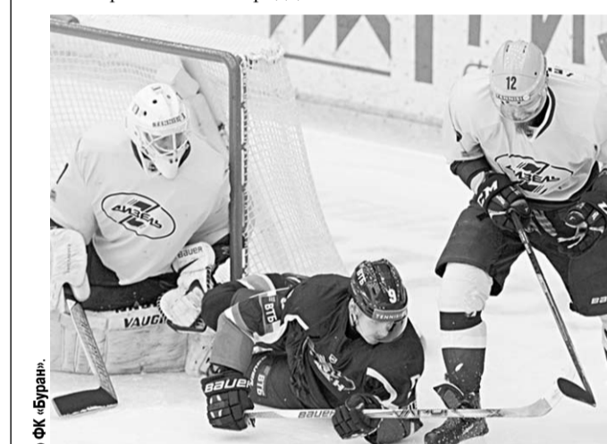
Хоккеисты «Бурана» успешно выступили на предсезонном турнире в Пензе, уступив лишь в одном матче «Дизелю».