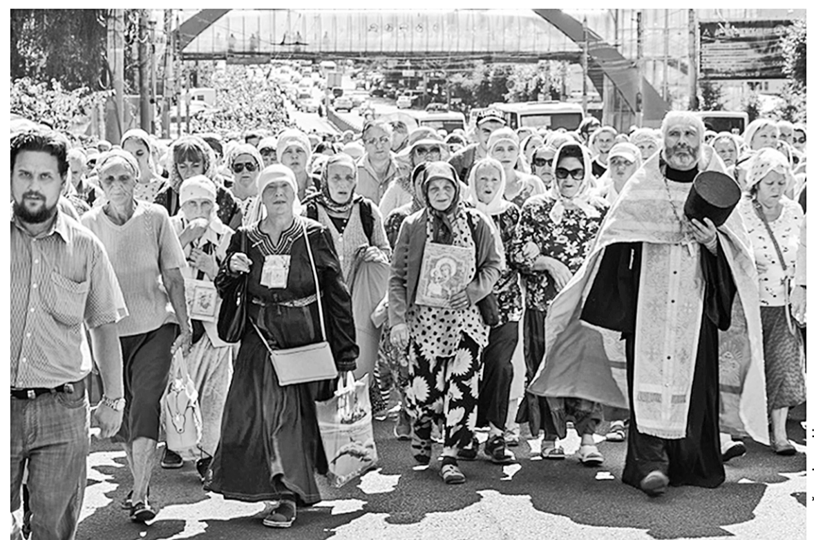
С молитвой в сердце и с Богом в душе.

Под звон колоколов передвижной звонницы паломники отправились в путь. В многолюдной колонне шли священнослужители и прихожане. Некоторые приехали для участия в крестном ходе из других городов. Над паломниками возвышались образы Воронежских святителей Митрофана, Тихона и Антония, Царственных страстотерпцев. Звучала молитва. Покинули Воронеж и по автодороге М-4 «Дон» направились к первому месту паломства – в село Чертовичье Рамонского района. В Задонск они должны прибыть 24 августа. Там они отдохнут, а затем примут участие в праздничных богослужениях в день памяти святителя Тихона, епископа Воронежского, Задонского чудотворца, в Рождество-Богородицком мужском монастыре у честных мощей святителя.