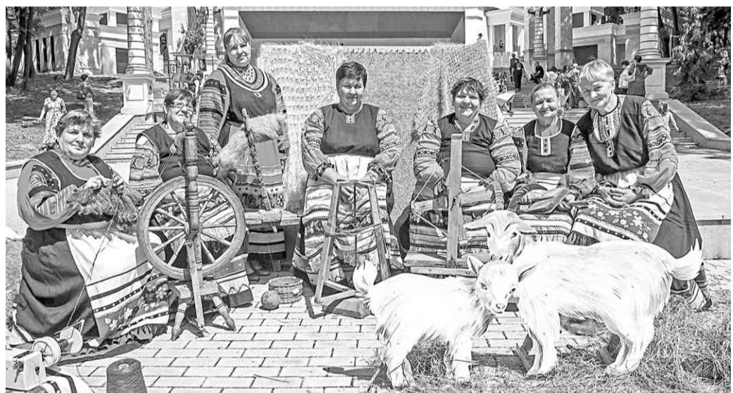
Музыкально-этнографическая картинка «Кудель».