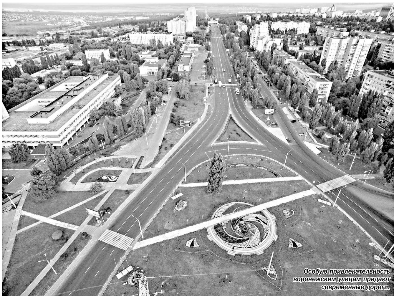
Особую привлекательность воронежским улицам придают современные дороги.

Участием в этих проектах региональный Союз дорожных организаций подтверждает своё намерение быть организацией, открытой для общества, настроенной на честный и продуктивный диалог. Ведь работа и самих дорожников всегда на виду у общества.