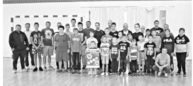
Эти жители Каменского района готовы к труду и обороне.