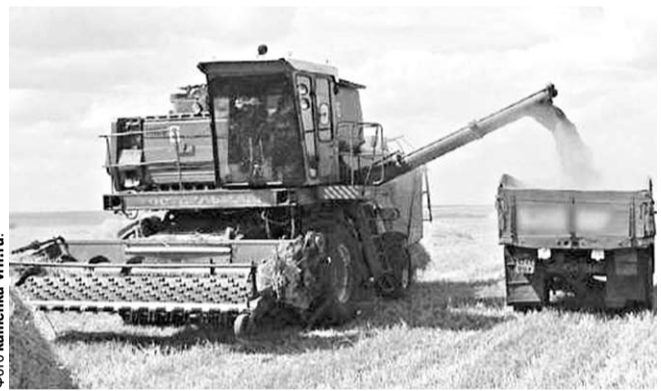
На полях района после полного завершения уборки ранних зерновых начинается сев озимых.