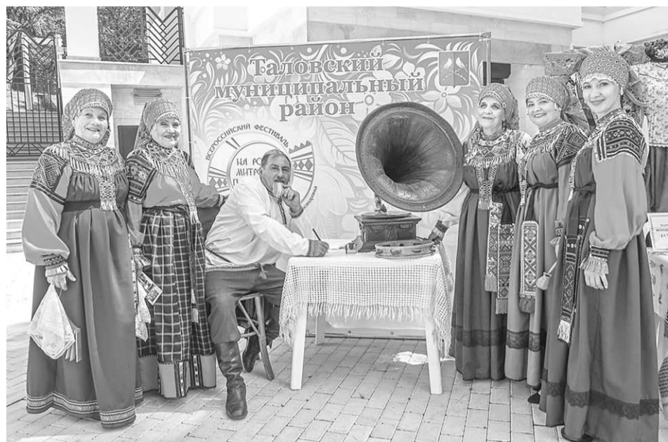
Народный ансамбль «Кладезь».

О том же, чем хорош был трехгодичный марафон Дней культуры и каковы его явные просчеты, думаю, стоит поговорить отдельно.