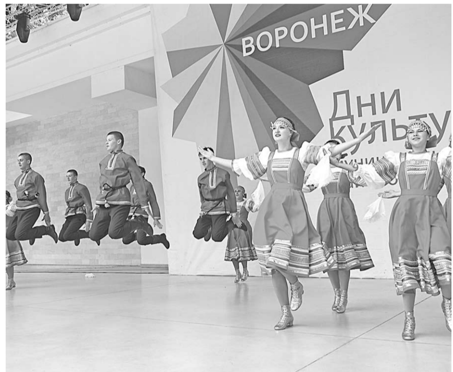
В вихре танца.