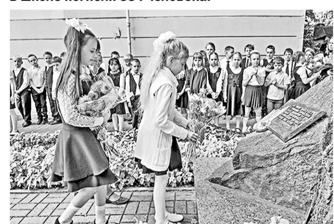
Третьеклассники возложили цветы к мемориальному камню.

День солидарности в борьбе с терроризмом отмечается в России 3 сентября — в связи с трагическими событиями 2004 года в Беслане. Тогда в результате захвата террористами в заложники детей, их родителей и учителей в школе погибли 334 человека.