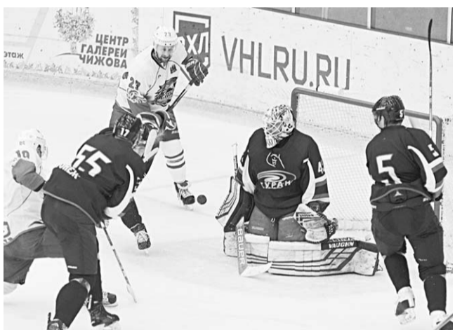
В домашних поединках с ростовчанами хоккеисты «Бурана» обменялись с соперником победами.