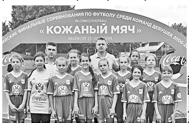
Команда «Антарес» из Воробьевки на финальных состязаниях в Майкопе.

Отлично выступила на Всероссийских финальных соревнованиях по футболу среди девушек 2006–2007 гг. рождения команда «Антарес» из Воробьевского района.