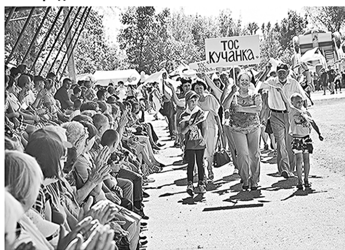
Зрители на трибунах приветствуют активистов ТОС «Кучанка».

На праздник собралось много гостей, в том числе из Воронежа, Наро-Фоминска Московской области и города Бирич Краснодарского района Белгородской области.