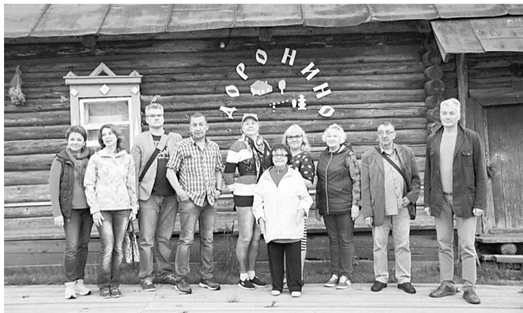
Фото на память о посещении «Доронино», где всё дышит стариной и историей.

На площади пятидесяти квадратных километров встретились четверть миллиона человек: 117 тысяч русских солдат и 132 тысячи французских. В ходе пятнадцатичасового сражения наши войска под натиском превосходящих сил противника были вынуждены оставить первоначальные укрепления. Русская армия потеряла убитыми, ранеными и пропавшими без вести не менее 45 тысяч солдат, а армия Наполеона — 35 тысяч. Кутузов, узнав о весьма опутных потерях, для того, чтобы сохранить армию, принял реше-