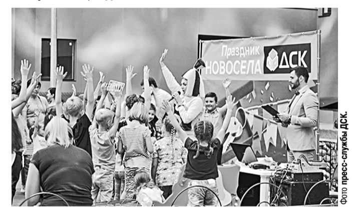
Как видите, у детей на Дне новосёла было отличное настроение.

Впервые проведённый Домостроительным комбинатом День новосёла пришёлся по душе и взрослым, и детям.