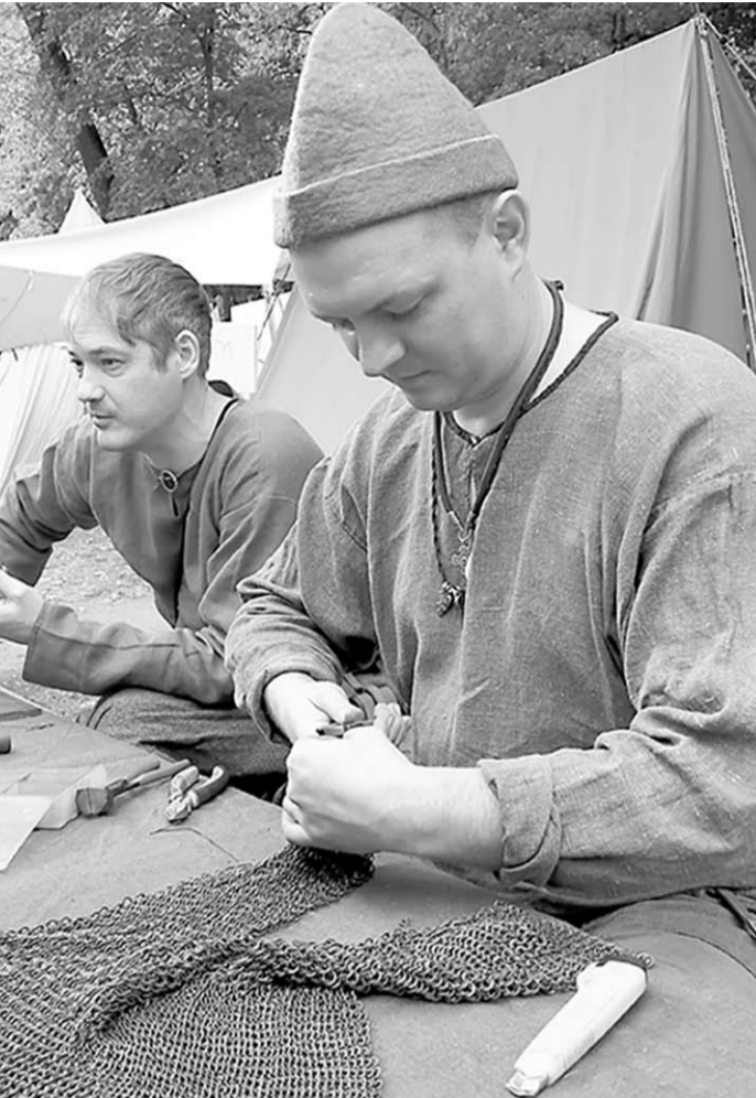
Мастер-класс по плетению кольчуги.

Изначально вместе с друзьями мы собирались в деревне на берегу реки Керженец, — рассказал предприниматель. И для меня это важно, потому что у меня воронежские корни, а сейчас я пишу исторический роман, события которого связаны с этой землей. Нас всех ещё ожидает возврат из городов в сельскую местность. Возврат к земле, к