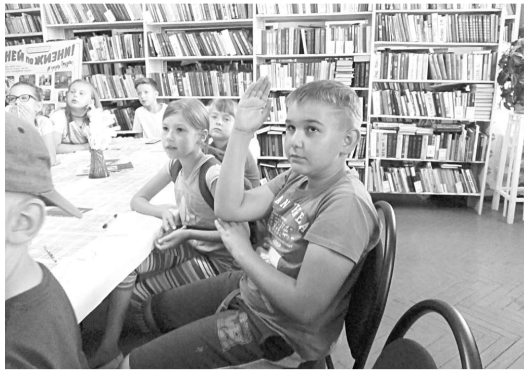
Конкурс «Грамотейка» вызвал у ребят множество неподдельных эмоций.

Культура | В Стрелицком библиотечном филиале, что в Семилукском районе, прошла интеллектуальная игра для школьников «Грамотейка»