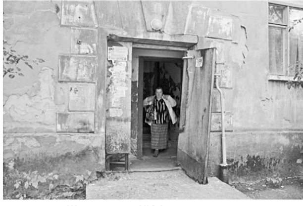
Жители дома №24 говорят, что их двухэтажка рассыпается на глазах.

Активисты Народного фронта просят власти Воронежа ускорить расселение аварийных домов на улице Солнечной.