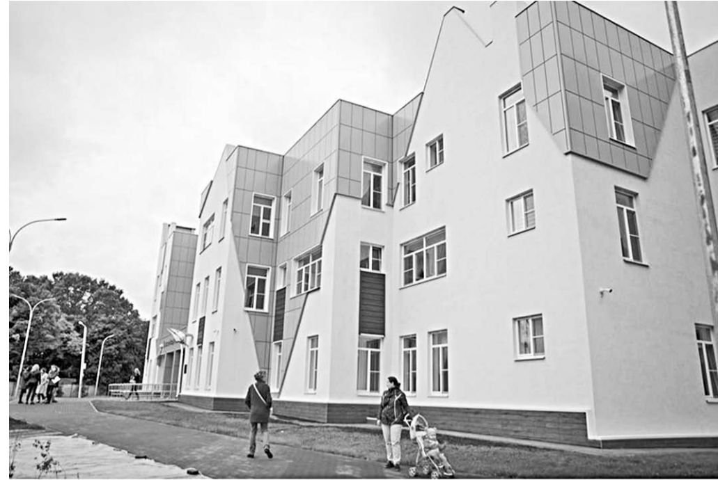
Так выглядит чудо-сад.