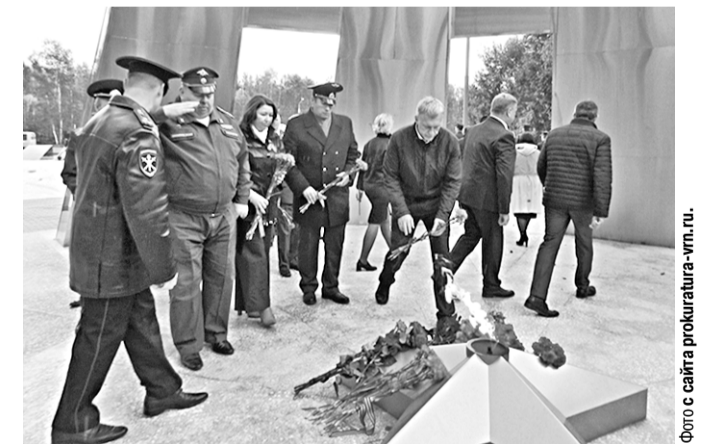
Цветы – к Вечному огню.

У мемориала погибшим в годы Великой Отечественной войны в Лисках состоялась торжественная церемония перезахоронения останков 72 красноармейцев.