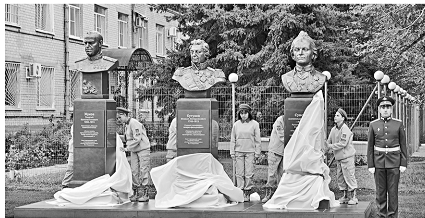
Открытие Аллеи воинской славы в военном городке.

Одно из крупнейших промышленных предприятий региона отпраздновало полуторавековой юбилей. На торжественном собрании, посвящённом 150-летию со дня его образования, глава региона отметил, что «Борхиммаш» – надёжный социальный партнёр правительства области. Совместно уже реализован ряд проектов, важных для развития Борисоглебска и повышения качества жизни его жителей. В планах на ближайшие годы – строительство современного спортивного объекта.