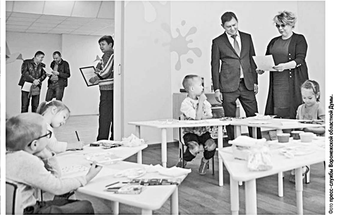
Детям создали комфортные условия.

Детский сад общеразвивающего вида №24 на бульваре Олимпийский, дом 8, в жилом комплексе «Ботанический сад», построенный в рамках нацпроекта «Демография», сейчас работает в тестовом режиме.