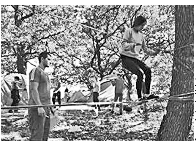
Непростое это испытание – «Маршрут выживания».

В Борисоглебском городском округе впервые состоялся профильный палаточный лагерь «Школа безопасности».