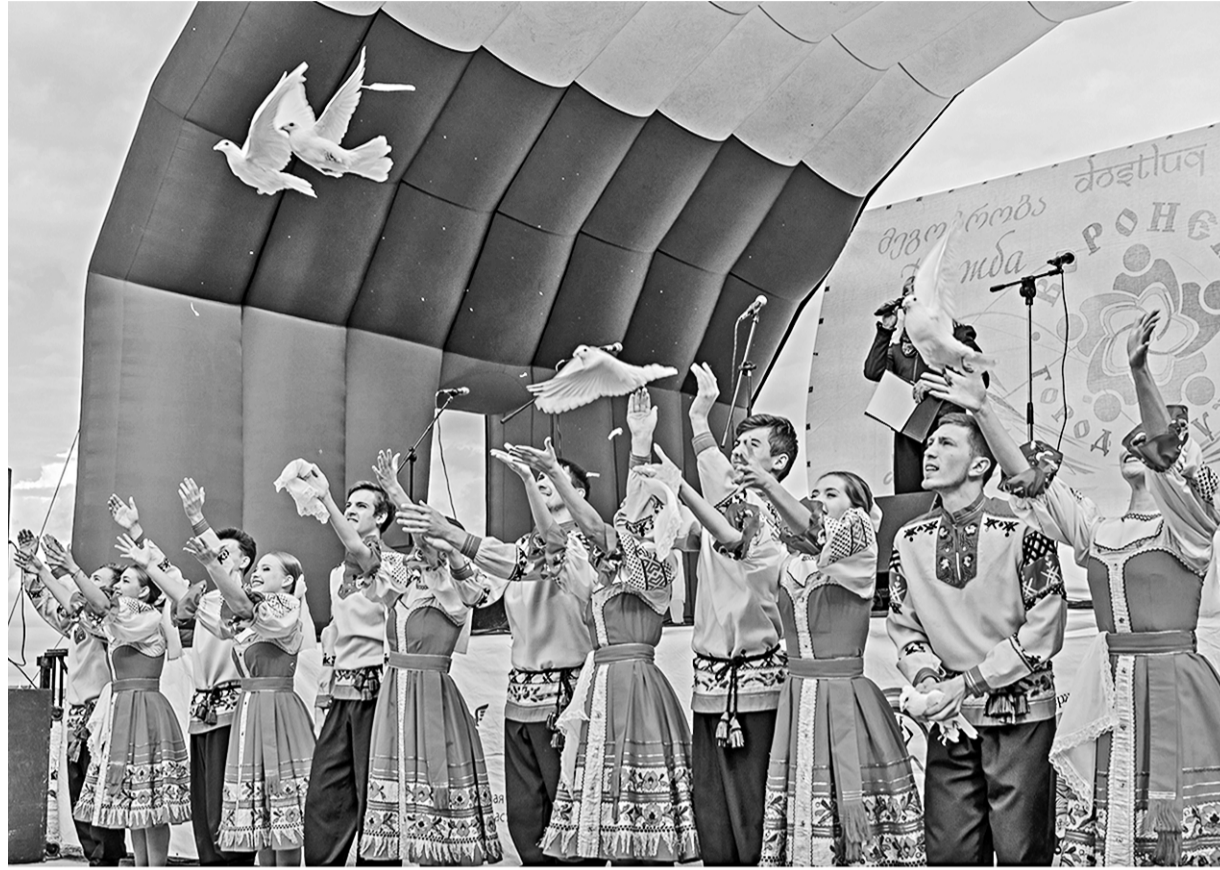
Вот такие мгновения праздника запечатлели наши фотокорреспонденты.