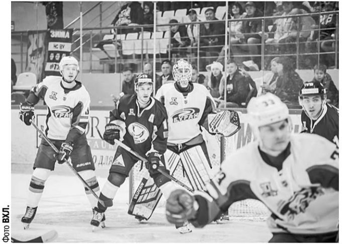
Несмотря на обилие острых атак, «Буран» потерпел в Караганде чувствительное поражение с сухим счётом 4:0.

«Сарьярка» (Караганда) – «Буран» (Воронеж) – 4:0 После небольшой паузы воронежцы отправились в дальнее турне по Казахстану и Сибири. Первая остановка была в Караганде. Несмотря на то, что «Сарьярка» нынешний сезон начала не совсем удачно, мы будем забывать, что этот клуб является действующим чемпионом Высшей хоккейной лиги!