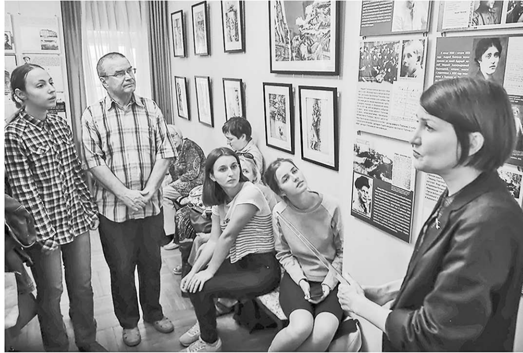
На открытии экспозиции «Прошу оставить как есть...»

которая посвящена сюжету лирически-прозаической повести «Джан».