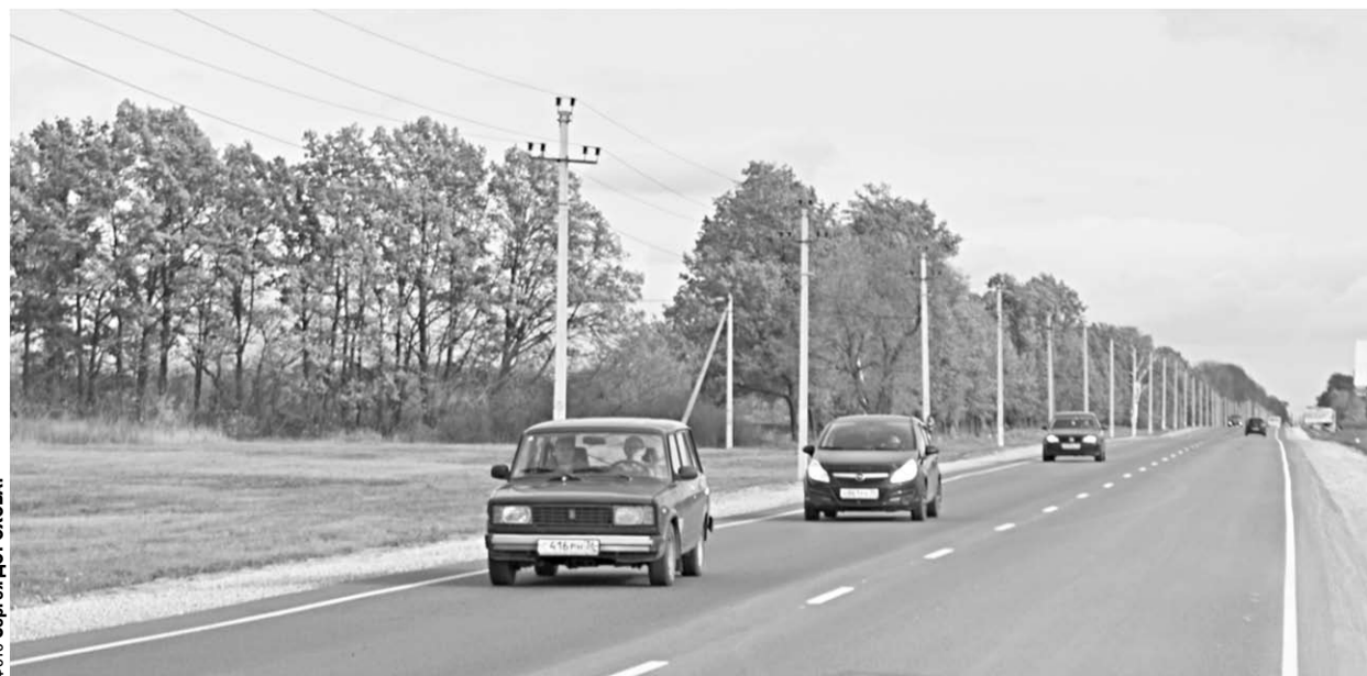
В Воронежской области обновили более 300 километров покрытия автомобильных дорог.