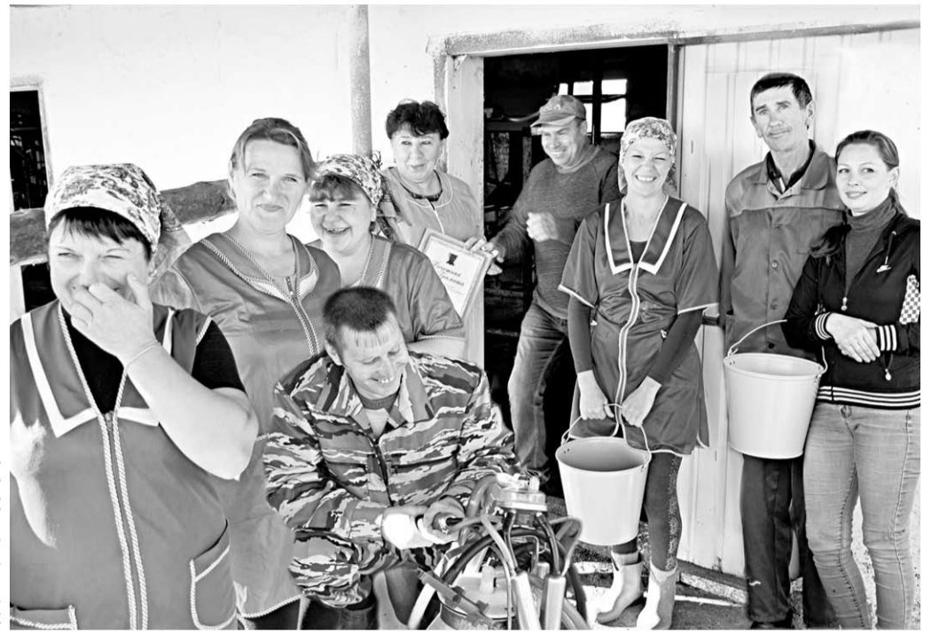
Животноводы лозовского предприятия «Рассвет» по праву считаются лучшими в районе.

Так или иначе, а за последние годы в Лозовом удалось сделать очень много. Например, построена современная школа — одна из лучших в округе. Стали появляться в новом асфальт и сельские улицы. В нынешнем году его продолжили как раз по той, что носит имя Героя Советского Союза Тимофея Авдеева. В различных уголках села построены детские игровые площадки, и теперь их пять, есть еще и две спортивные площадки. Нынешний юбилейный год стал для села «светлым» и в прямом смысле этого слова: в Лозовом смонтировано 239 светильников, и на всех улицах теперь светло и днем, и ночью. К тому же все сельские