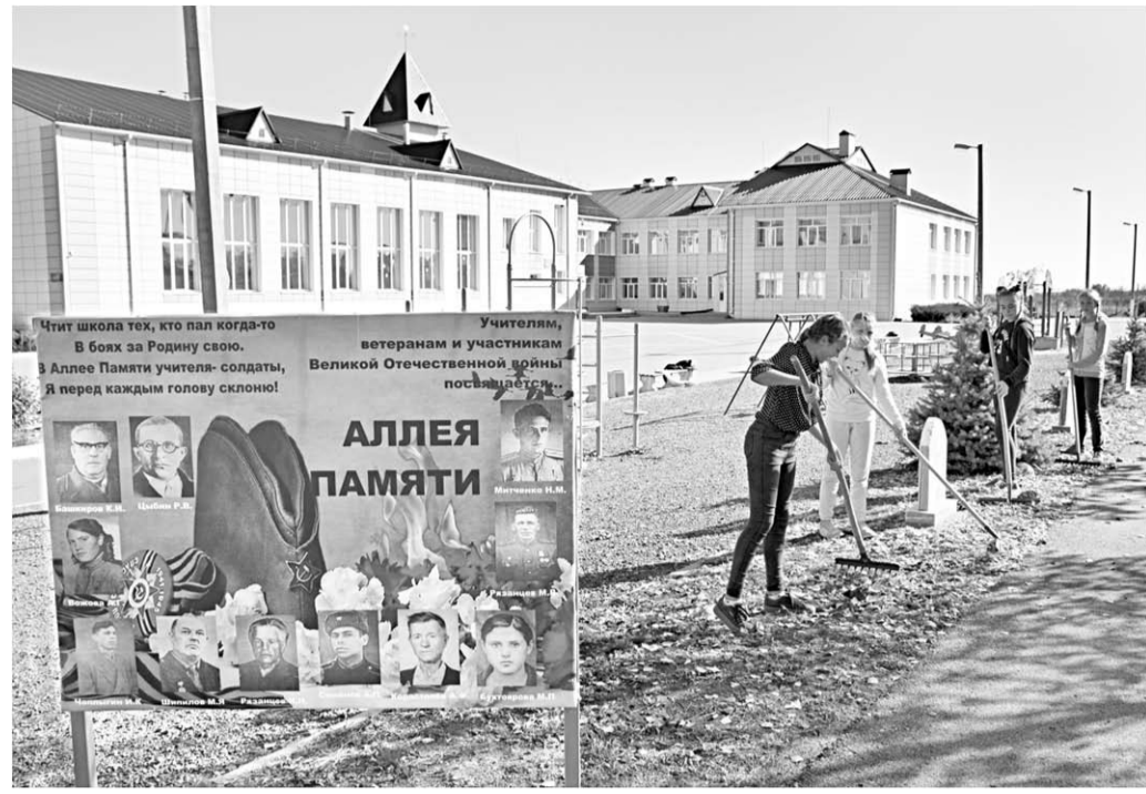
В День знаний в Лозовской средней школе открыли Аллею памяти.