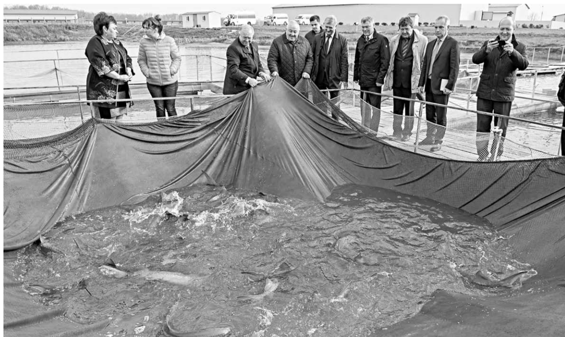
На территории питомника в селе Верхняя Тишанка разводят несколько видов рыбы.

На территории питомника расположены гостиница для туристов и контактный мини-зоопарк, строится кафе. Здесь разводят несколько видов рыбы. В проект вложено 300 миллионов рублей. Губернатор Александр Гусев в ходе рабочей поездки в Таловский район сказал по поводу увиденного: «Идея такого туристического оздоровительного комплекса очень правильная, инвестором сюда вложены большие средства. Здесь будут развивать экотуризм, оздоровительные услуги. Но, наверное, надолго человека тут занять сложно, ведь задача – предоставлять комплексную туристическую услугу. Мы должны найти варианты, чтобы турист приехал сюда, поселился в гостинице на несколько дней и имел при этом возможность увидеть другие интересные объекты в окрестностях, соседних районах. Нужно уходить от традиционных подходов формирования туристических маршрутов. Просто смотреть на красивое здание уже не всем интересно, а вот посетить уникальные уголки природы или узнать о легенде того или иного объекта – вот это здорово».