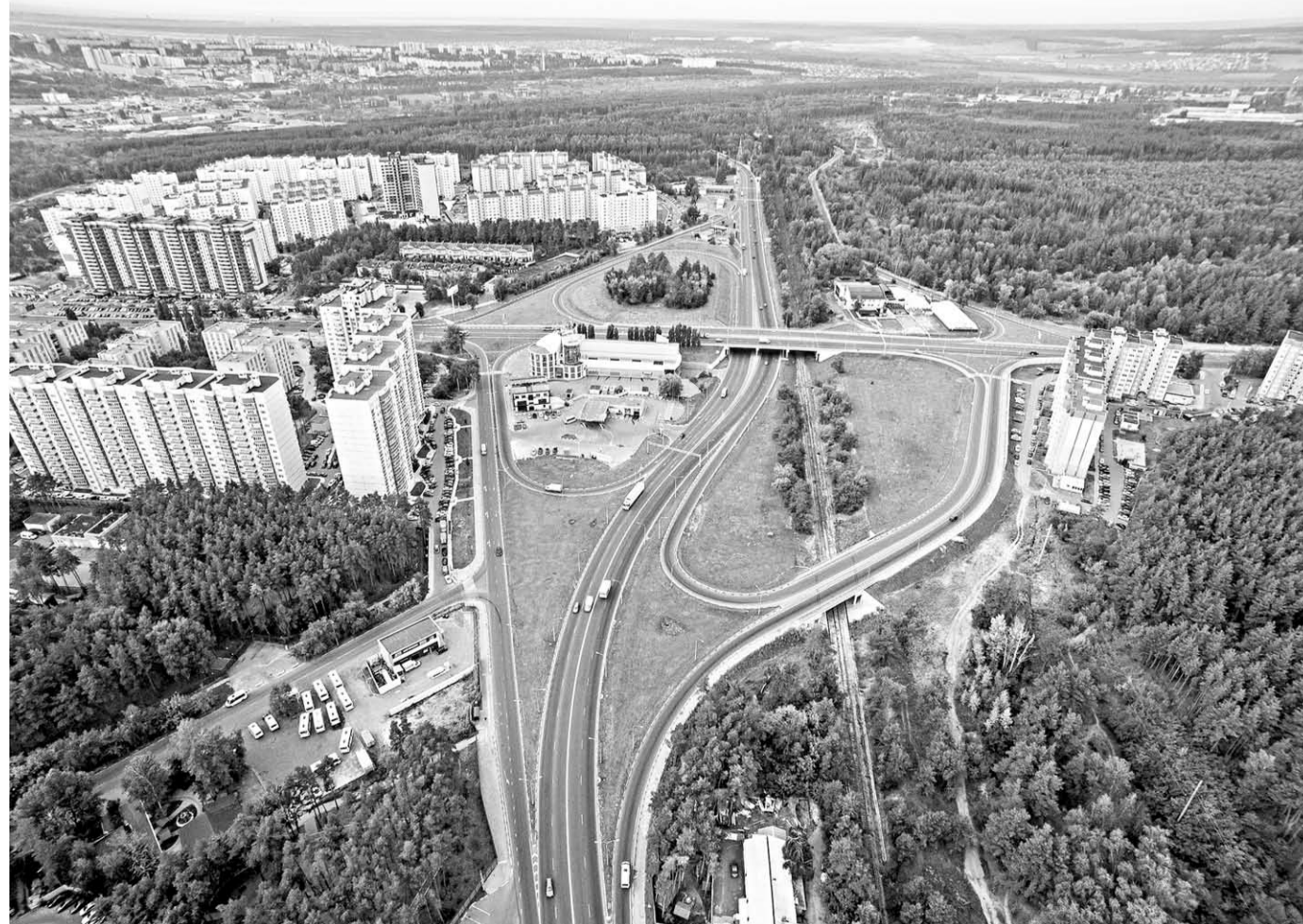
По реализации национального проекта «Безопасные и качественные автомобильные дороги» Воронежская область вошла в тройку лучших регионов Центрального федерального округа.

В такой день принято подводить итоги проделанных за дорожно-строительный сезон работ. И они весьма впечатляющие. Ремонт дорог в Воронежской области проводится в рамках приоритетного национального проекта Минтранса РФ «Безопасные и качественные автомобильные дороги». В столице Черноземья он реализуется уже третий год подряд, а на территории региона – второй. Главной заслугой проекта БКАД многие подрядчики считают то, что в приоритете дорожников теперь не ямочный ремонт, а полноценные работы, которые дарят дорогам вторую жизнь. Для автомобилистов и пешеходов немаловажно то, что производящая ремонт дорожная организация даёт пятилетнюю гарантию.