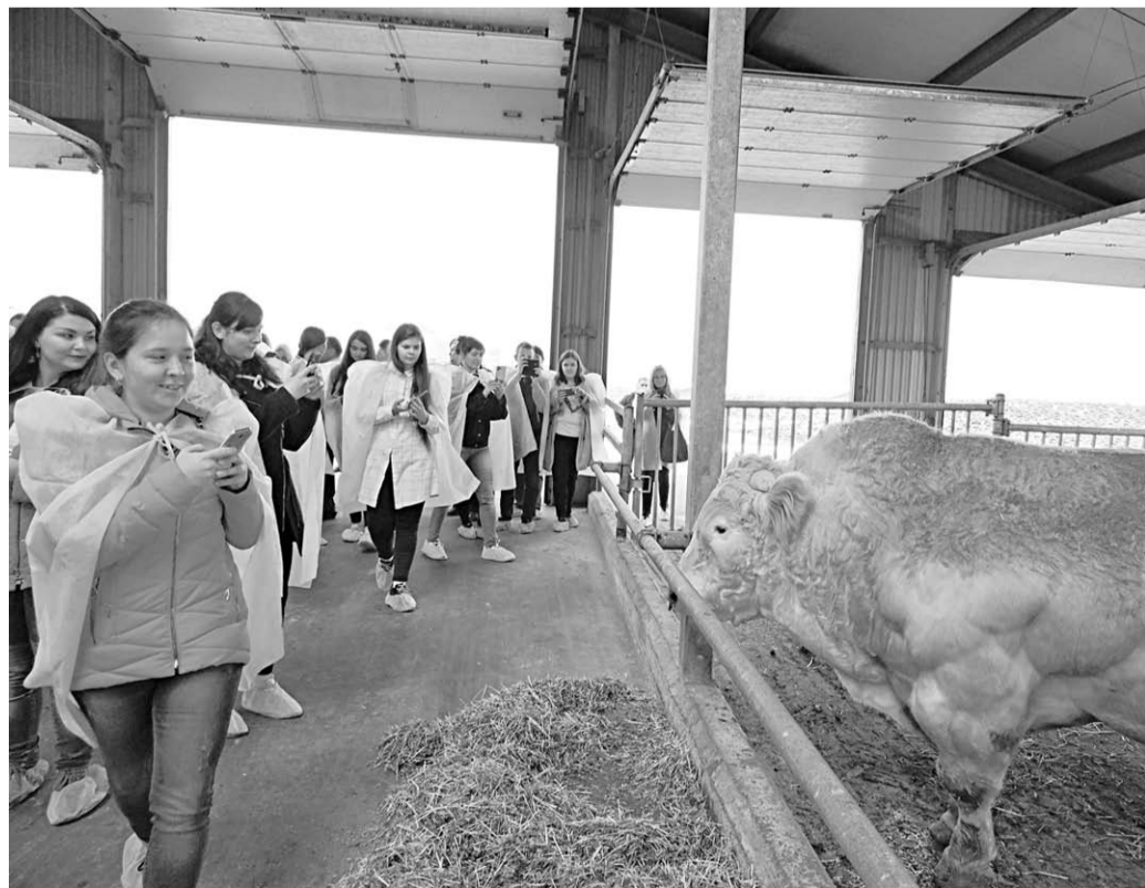
Быки бельгийской голубой породы охотно позировали перед объективами.

На самой крупной в регионе молочной ферме содержится около 16 тысяч голов КРС. Из них четыре с половиной тысячи – дойное стадо, представленное четырьмя породами: монбельярд, джерси, голштино-фризская и воронежская краснопестрая. На сегодня здесь получено 27 тысяч тонн молока. Средний надой по предприятию – 25 килограммов в сутки от коровы, а некоторые рекордсменки дают до 70 килограммов. Причем содержание жира и белка в молоке очень высокое.