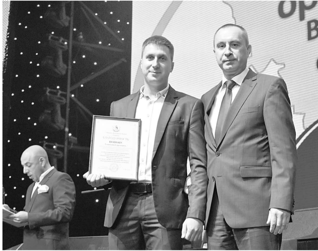
Награды – достойным.

Экономика | Новые дороги меняют жизнь тысяч людей, делают её более мобильной, удобной и комфортной