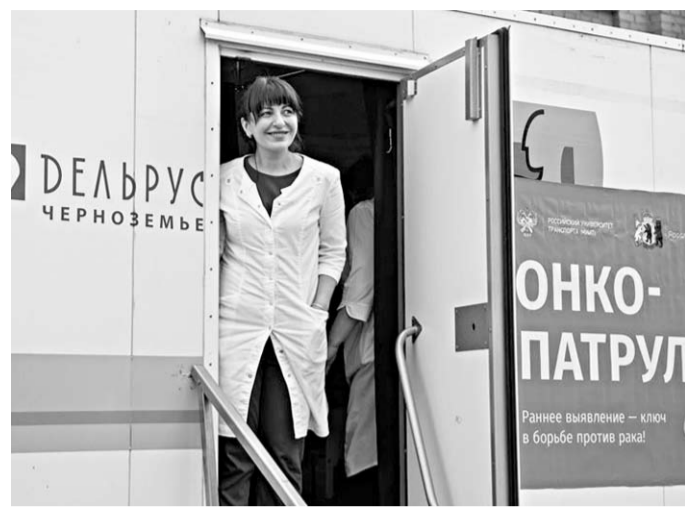
Всероссийская акция «Онкопатруль» проходит в рамках федерального проекта.

«Онкологические заболевания являются одной из главных причин смертности не только в нашей стране, но и в мировом масштабе. По