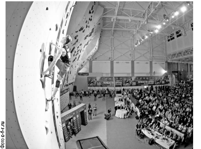
Обновлённый воронежский скалодром получил высокие оценки специалистов и готов принять соревнования самого высокого уровня.

Международный турнир состоялся в бывшем спорт-комплексе «Энергия», который теперь носит название «Гран-При». Реконструкция в нём ещё не завершена, но уже сейчас обновлённый скалодром получил высокие оценки специалистов. Планируется, что летом следующего года в Воронеже состоится чемпионат мира среди взрослых спортсменов.