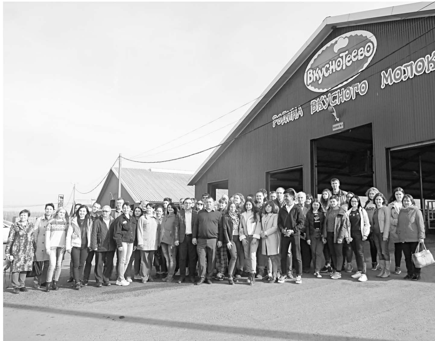
У каждого из участников экскурсии останутся не только положительные эмоции от увиденного, но и фотография на память.

Дойка происходит в залах «карусель» и «елочка». Гостям из ВГАУ показывают работу «карусели». Крутятся она практически круглосуточно, с двумя двухчасовыми перерывами на промывку – после утреннего и вечернего доения. Дойный зал рас-