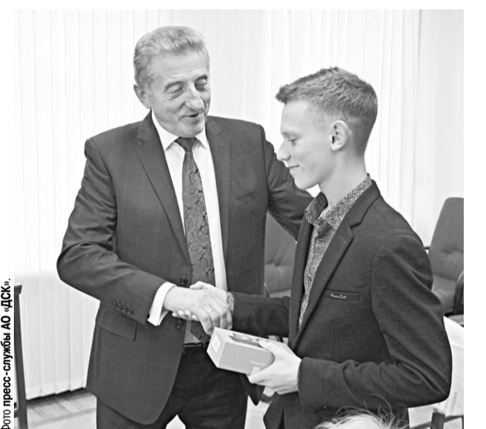
Сенатор Сергей Лукин жмёт руку юному герою.

Мужественный, самоотверженный поступок подростка из Калачеевского района Воронежской области служит подтверждением тому, что будущее России – в надёжных руках, что молодое поколение – достойная опора нашего государства, – подчеркнул член Совета Федерации Сергей Лукин.