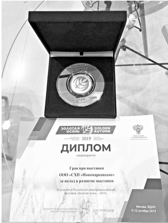
Новомарковцы привезли домой Гран-при за вклад в развитие российской агропромышленной выставки «Золотая осень-2019».

Вотому году «Золотая осень» прошла под девизом «Возможности вне границ». Главными темами стали планы развития АПК, внедрение новых технологий и эффективных форм хозяйствования, необходимость повышения рентабельности аграрного производства. Аграрии страны демонстрировали крупные инвестиционные проекты, достижения в селекционно-генетической сфере, инновационные решения для агропромышленного комплекса, проекты развития сельских территорий и сельскохозяйственной кооперации. А ещё делились передовым опытом, обсуждали с руководителями органов управления агропромышленного комплекса актуальные вопросы, связанные с развитием сельскохозяйственного производства. Общая площадь экспозиции «Золотой осени-2019» составила 26,5 тысячи квадратных метров. Всего в выставке приняли участие свыше 1500 предприятий из 50 регионов России, 77 компаний из 17 зарубежных стран.