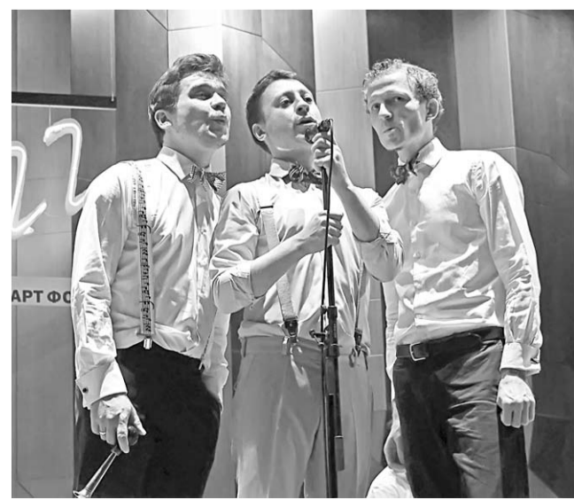
Участники джазового оркестра играли, пели и свистели.

раньше, потому что коллектив, выступающий в первом отделении, должен успеть выступить в Липецке». Это был Большой Джазовый оркестр Петра Востоктова, который на час помог слушателям перенестись в эпоху Золотой джазовой лихорадки. Коллектив использует винтажные и необычные (вроде стиральной доски) инструменты, оригинальные партитуры – и юмор. Во втором отделении поднял зрителя с мест вокальный секстет The Georgian Six, основанный дирижерами академического хора Тбилисской консерватории. Гости показали яркий синтез классики с оригинальным джаз-фолком: они занимаются популяризацией грузинской музыки.