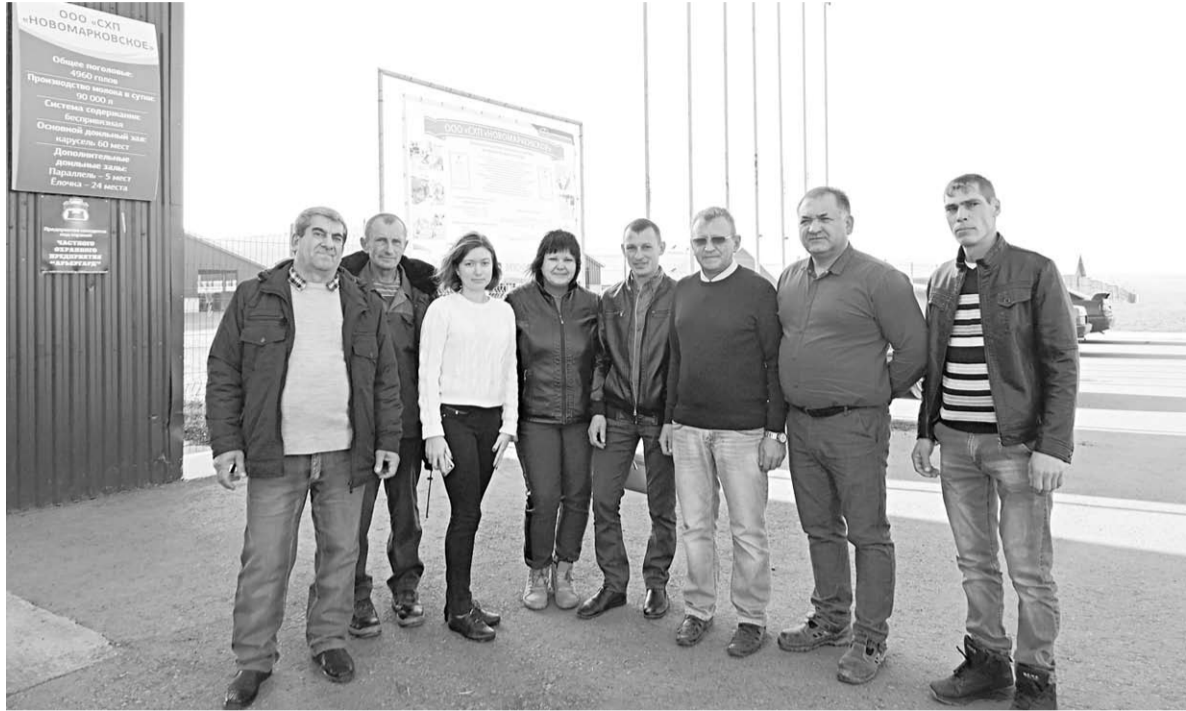
Делегация ООО «СХП «Новомарковское» на 21-й российской агропромышленной выставке «Золотая осень» в Москве.

По традиции самым представительным стал блок, посвященный животноводству и племенному делу. Свои разработки в области генетики и разведения животных представляли ведущие отечественные селекционно-генетические центры и научные организации. Среди них выделялись и наши земляки из ООО «СХП «Новомарковское», представившие выращенных в племенном репродукторе питомцев.