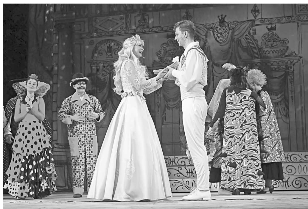
Сцена из спектакля «Золушка».