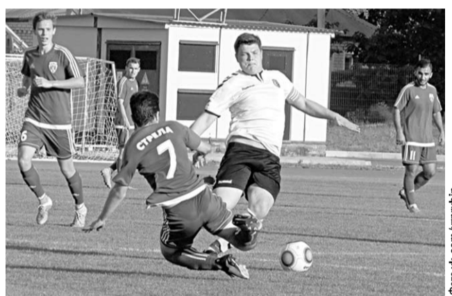
Лучшей футбольной командой Воронежской области стала воронежская «Стрела».