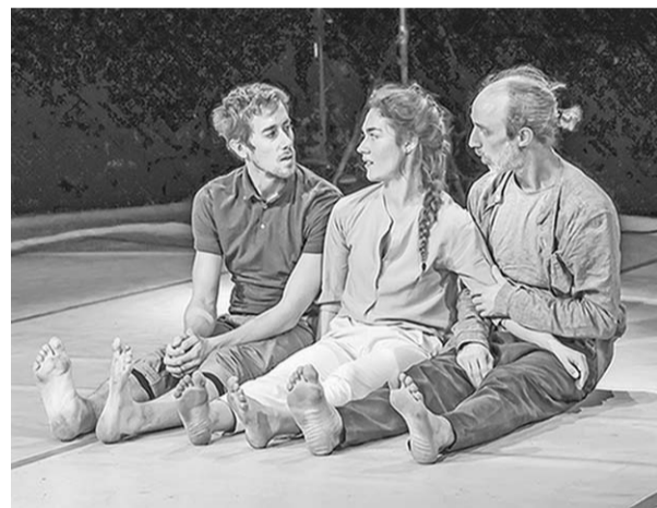
Сцена из спектакля «10:10».

Короткий, около 45 минут, спектакль «10:10» – детище NYASH Co (Бельгия) и Кэролайн Корнелис. Начало выглядит многообещающе. Человечески, старательно чистивши, пока зрители заняли места, большой щёткой пол малой сцены Кольцовского театра, садится за барабаны и выдаёт мощное соло. По бокам сцены появляются и замирают, словно готовясь к прыжку, три исполнителя: двое мужчин, одна девушка.