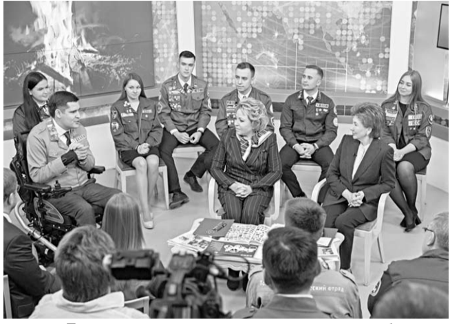
Представители студенческих отрядов пообщались с Председателем Совета Федерации Федерального Собрания РФ Валентиной Матвиенко и её заместителем Галиной Кареловой.

По итогам работы 2019 года Воронежское региональное отделение молодёжной общероссийской общественной организации «Российские студенческие отряды» стало вновь лучшим в ЦФО и пятым в России.