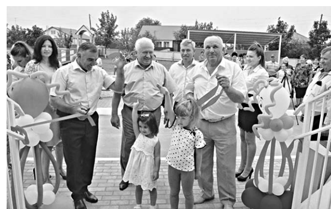
Это событие стало праздником для всего села.

В селе Данцевка Богучарского района состоялось открытие дошкольной группы «Капельки» на 25 человек.