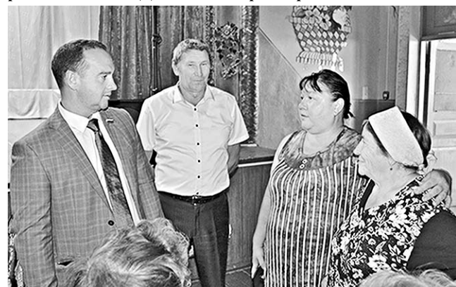
Откровенный разговор о будущем села.

В Филоновском сельском поселении Богучарского района состоялся День администрации района.