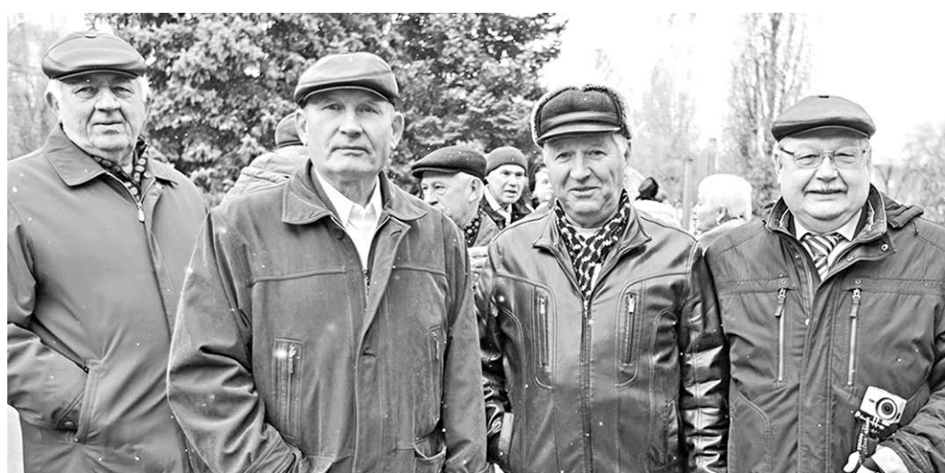
Бесценен опыт старшего поколения.

В честь юбилея «Росводоканал Воронеж» организовал для горожан настоящий праздник под гармонь. Сотрудников и ветеранов предприятия, а также посетителей, пришедших в головной офис по вопросам водоснабжения и водоотведения, в этот холодный промозглый осенний день гостеприимно встречали люди в тулупах и валенках с вкусным горячим чаем из самовара, баранками и сладостями.