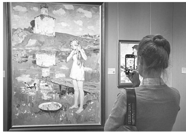
На выставке «Сокровища музеев России».

Хронологически она охватывает период с конца XVII до второй половины XX века и включает в себя несколько десятков уникальных произведений ключевых российских художников, от икон конца XVII века до соцреалистических полотен, собранных из различных уголков страны. В качестве организаторов художественного события выступили проект «Россия – Моя история», Государственная Третьяковская галерея, ГМВЦ «РОСИЗО».