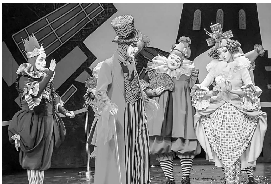
Сцена из спектакля «Кот в сапогах».

Казалось бы, Каштанке повезло: у дрессировщика она сытно ест, приобрела друзей, да еще получила интересную