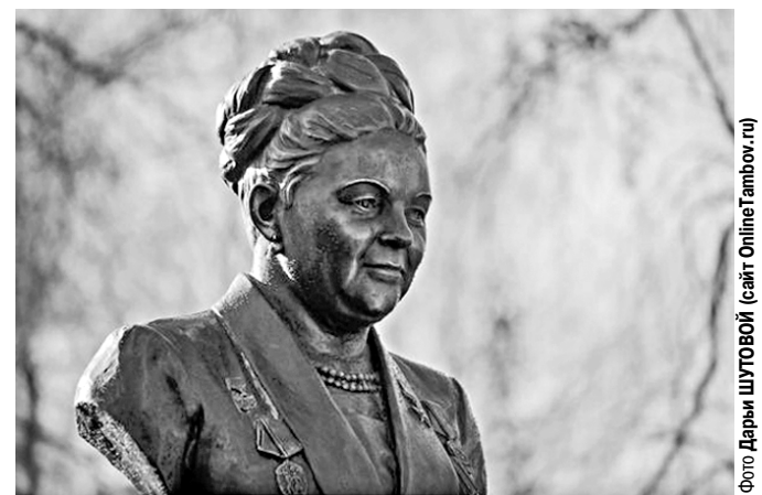
Бюст Марии Мордасовой.

В селе Черняное Тамбовской области торжественно открыли бюст народной артистки СССР, Героя Социалистического Труда, исполнительницы русских народных песен и частушек Марии Николаевны Мордасовой.