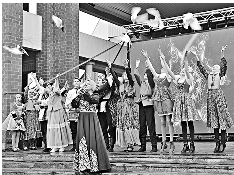
«Мы все должны объединиться под флагом великой России», – таков основной лейтмотив праздника.

Митинг возле культурно-досугового центра «Северный» собрал как представителей крупных политических партий – «Единой России», ЛДПР, так и небольших общественных объединений; например, нельзя было не заметить флаги молодежной женской организации «В красоте – сила!».