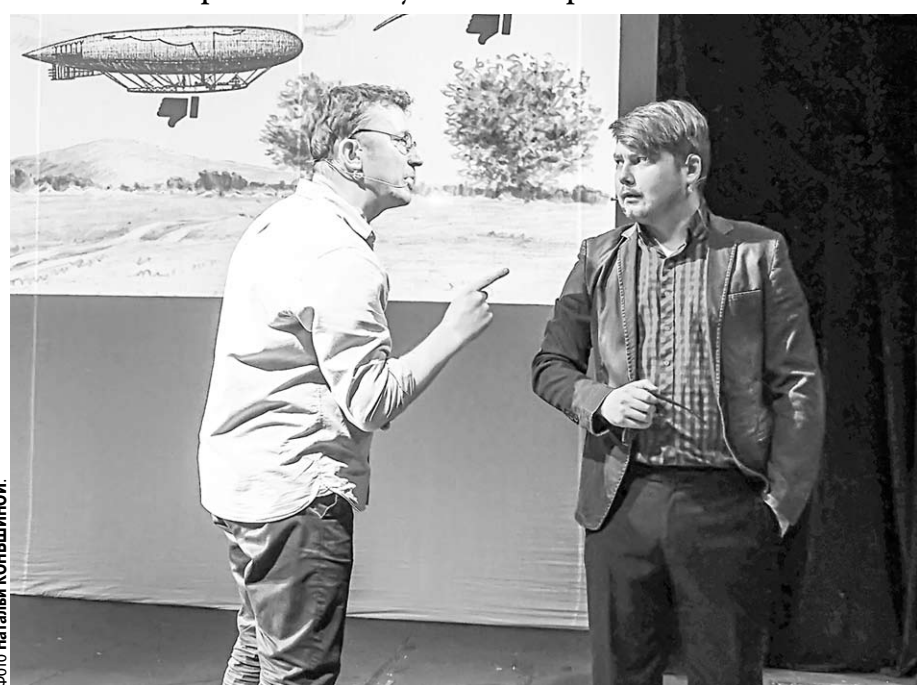
Сцена из спектакля «Космос. Начало».

На международном фестивале МАРШАК в Воронеже детям рассказали историю о том, как мечты приводят к научным открытиям