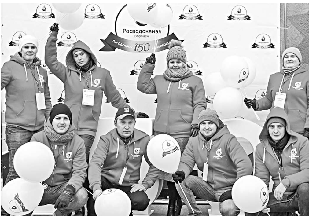
Будущее водоканала – за Советом молодых специалистов.

По словам генерального директора, «РВК-Воронеж» – современная компания с огромным профессиональным опытом, которая чтит свою историю. Нынешний праздник объединил несколько поколе-