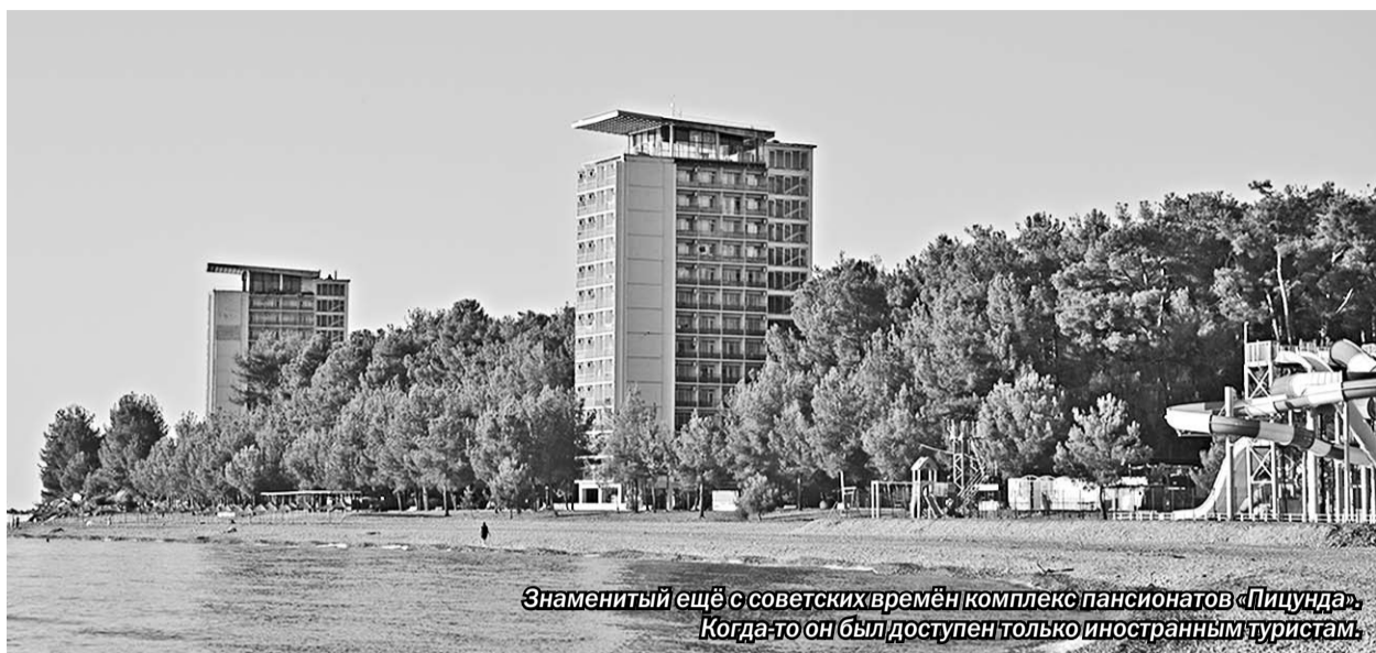
Знаменитый ещё с советских времён комплекс пансионатов «Пицунда». Когда-то он был доступен только иностранным туристам.

И высказал такое предложение: Мы вам покажем весь историко-культурное наследие, объекты размещения. У нас есть желание, чтобы вы все увидели своими глазами, какая она, Абхазия, сегодня. И до-