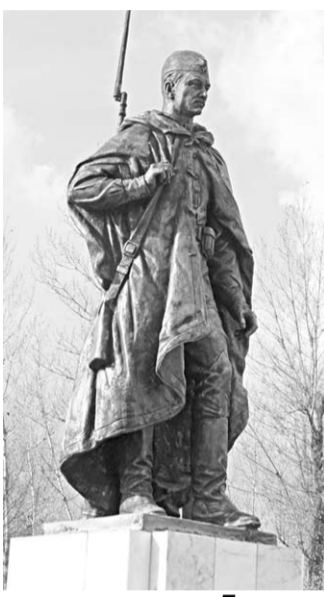
Памятник в Новотроицком.

Он расположен в сельском сквере. Скульптуру солдата в амуниции времен Великой Отечественной войны изготовили в Жуковском Московской области. Первый памятник на этом месте установили ещё в 1955 году. С годами постамент и фигура воина частично разрушились. Рядом с ним расположена Стена памяти, которую благоустроили два года назад. Средства на новый памятник в размере одного миллиона рублей выделены в рамках областной программы «Содействие развитию муниципальных образований и местного самоуправления». Софинансирование из районного бюджета составило 115 тысяч рублей.