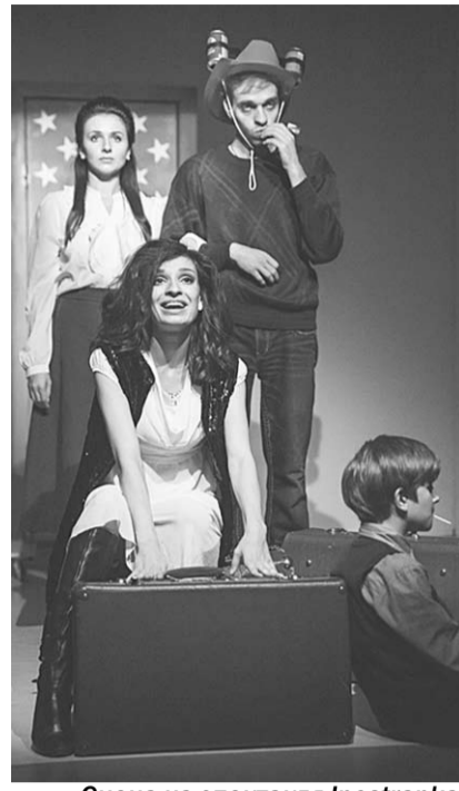
Сцена из спектакля Inostranka.

Инсценировку артисты сделали общими силами. Функции режиссёра-