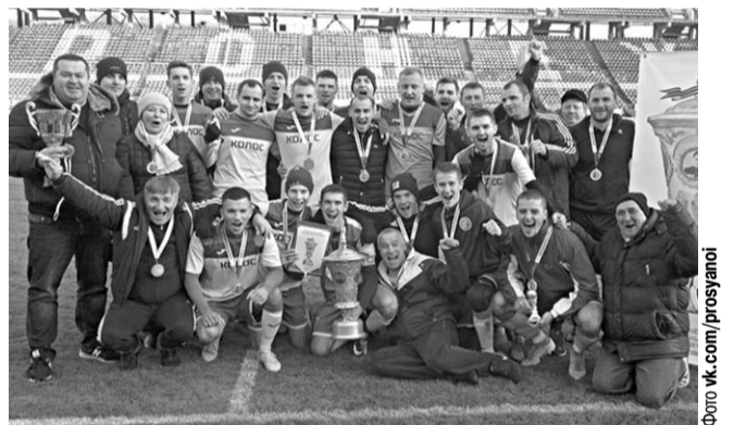
«Колос» (Лискинский) – обладатель главного трофея мемориала Просяного.

На редкость упорными выдвигались полуфинальные поединки. После сверхрезультативной ничьей 4:4 на выезде кантемировский «Котоффей» в домашней игре сломил сопротивление представителя Лискинского района – «ЭкоНиваАгро» – 1:0. А лискинский «Колос» и острожский «Колос-Придонье» дважды сыграли вничью – 1:1 и 0:0. За счёт мяча, забитого в гостях, в финал пробился коллектив СПК «Лискинский».