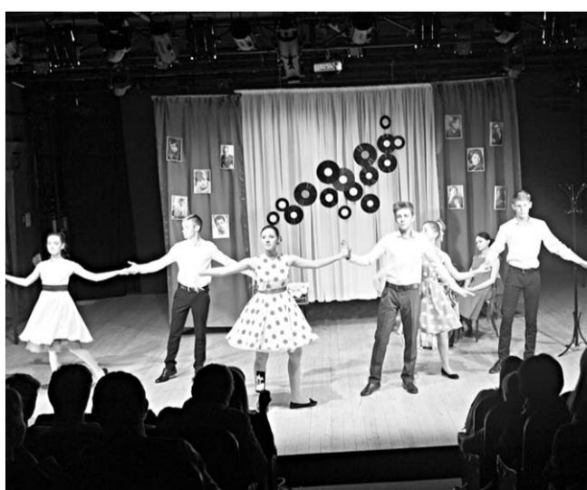
Сцена из спектакля «Всё начинается с любви».

Театр «Этюд» Петропавловской школы стал лауреатом Третьего регионального фестиваля школьных театров.