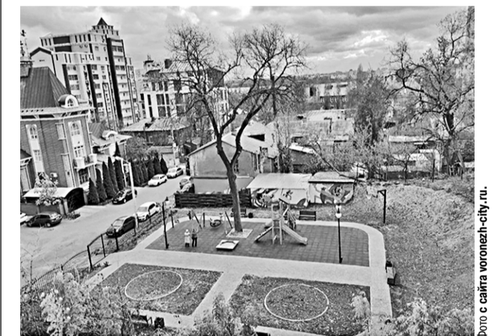
Так выглядит новая зона отдыха в Воронеже.

В Центральном районе Воронежа на месте снесённого аварийного дома №3 по улице Лётчика Замкина появился «Чернавский» сквер.