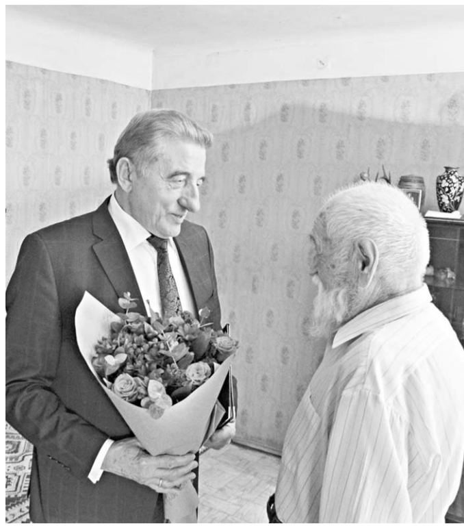
Сенатор поздравляет ветерана с вековым юбилеем.