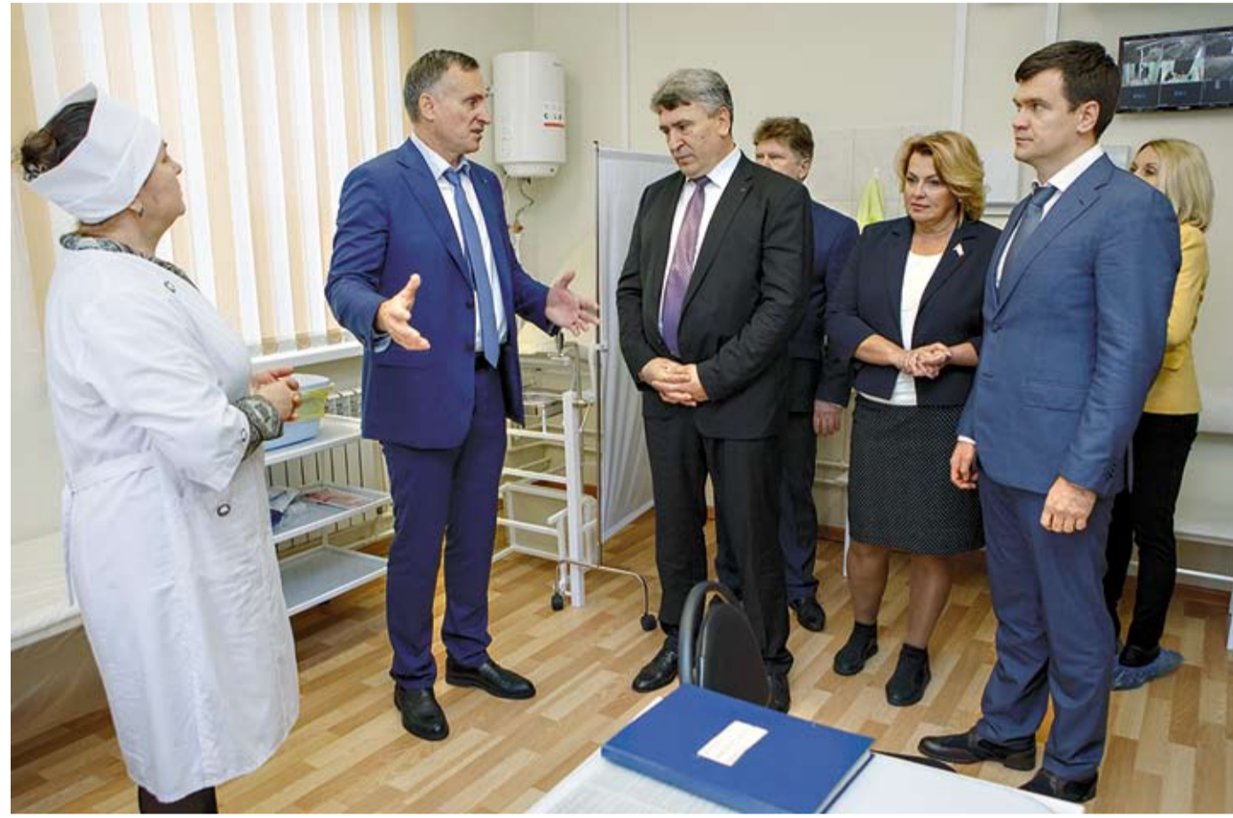
Депутаты областной Думы во время посещения объектов здравоохранения в Новоусманском районе.