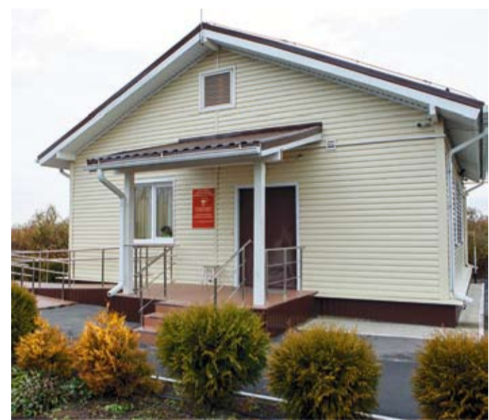
Так выглядит типичный сельский ФАП.

Масштабный региональный проект «Борьба с онкологическими заболеваниями» требует подготовки дополнительного количества специалистов. Среди них онкологи, рентгенологи, медицинские психологи и физиотерапевты.