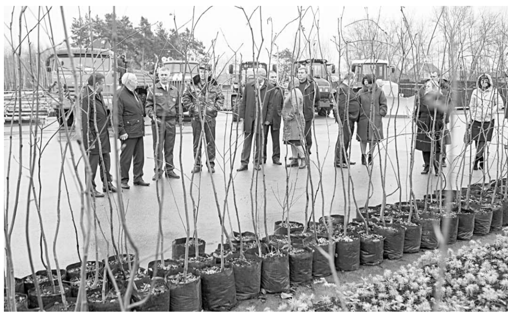
Депутаты осмотрели цеха и оборудование для переработки лесосеменного сырья.

Парламентарии, которые представляют Комитет по экологии и природопользованию, провели выездное совещание и познакомилась с работой Воронежского лесного селекционно-семеноводческого центра.