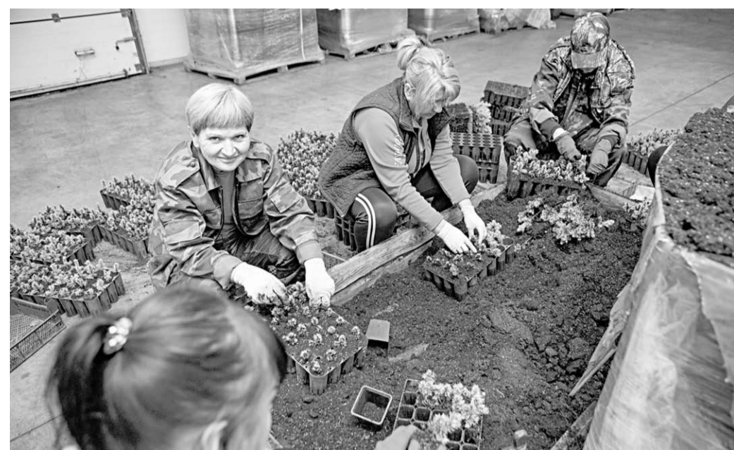
Именно с проросших семян берут своё начало будущие сосновые леса и дубравы.

Среда обитания | Депутаты Воронежской областной Думы обсудили реализацию национального проекта «Экология» в регионе