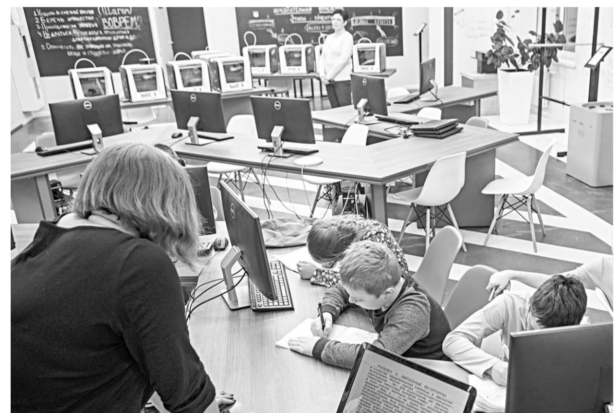
В успех каждого ребёнка, в раскрытие его способностей, в формирование его будущих компетенций государство вкладывает огромные средства.

— Каждому ребёнку вне зависимости от его способностей и места проживания необходим индивидуальный подход. Наша цель — со-