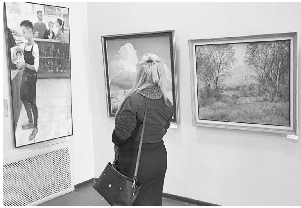
Пристально всматривались посетители выставки в картину Г.Шилиной «Время кофе».

Вернисаж | «Цвет осени» – так называлась только что завершившаяся выставка, проходившая в главном художественном зале, что на улице Кирова