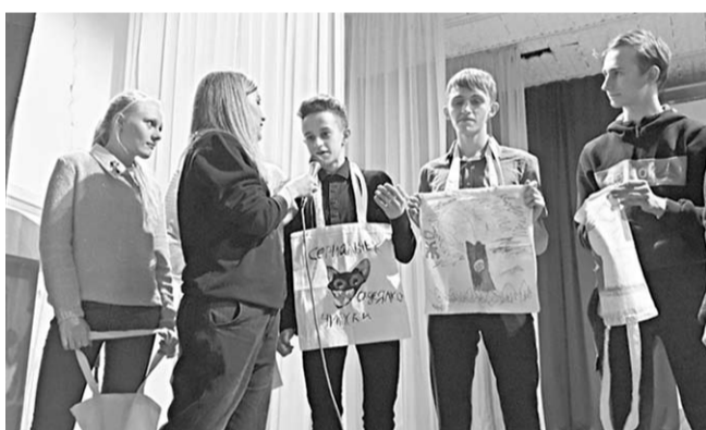
Студенты призывают не мусорить и пользоваться урнами.

Участники воронежской команды рассказали им о проектах, реализуемых молодёжью на направлении Народного фронта. Ребята вместе расписали экомуски, на которых изобразили волнующие их проблемы экологии. Затем они защищали свои арт-проекты. Больше всего голосов получила экомуска с картинкой о загрязнении городов мелким мусором, который люди зачастую бросают под ноги.