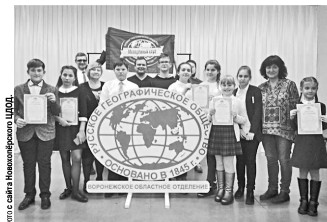
Команда новохопёрцев и представители Воронежского отделения географического общества.

Школьники из Новохопёрского центра дополнительного образования детей назвали победителями и призёрами одиннадцатой конференции Воронежского отделения Русского географического общества.