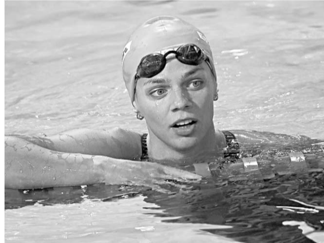
Титулованная спортсменка Юлия Ефимова находит время для общения с юными пловцами.

В начале встречи титулованная спортсменка провела автограф-сессию и ответила на вопросы спортсменов и болельщиков. Затем состоялся мастер-класс по технике плавания для юных спортсменов. Юлия Ефимова показала ребятам свои любимые упражнения на воде, а в завершение провела эстафету среди юных пловцов.