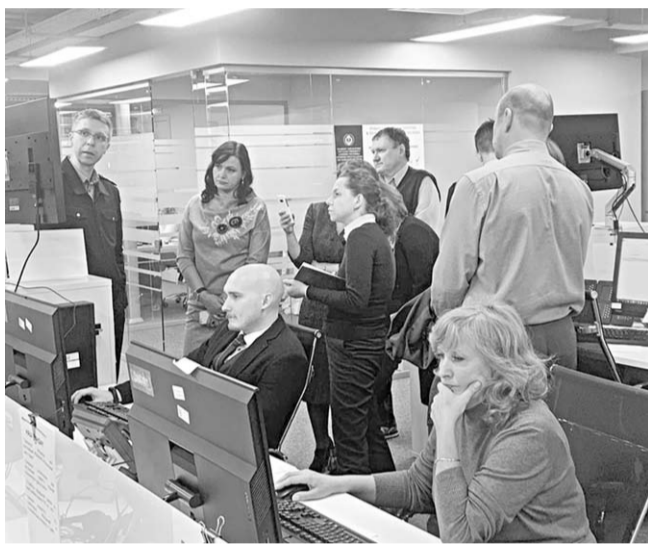
В Единой диспетчерской службе.

Представители органов жилищного надзора трёх регионов совместно с коллегами из Министерства государственного управления Московской области обсудили перспективные направления реформирования контрольно-надзорной деятельности. Участники встречи посетили городской округ Королёв, где им продемонстрировали работу Центра управления городского округа и Единой диспетчерской службы муниципалитета.