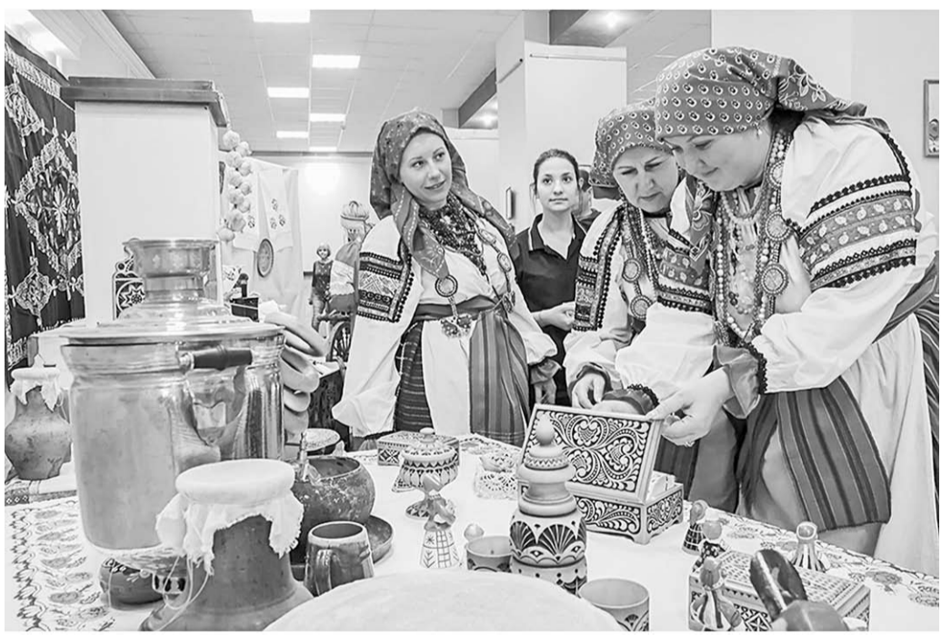
В фойе ТЮЗа развернулась подворье.