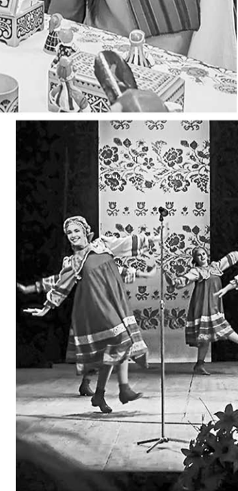
Юбилера поздравляли песнями и танцами.