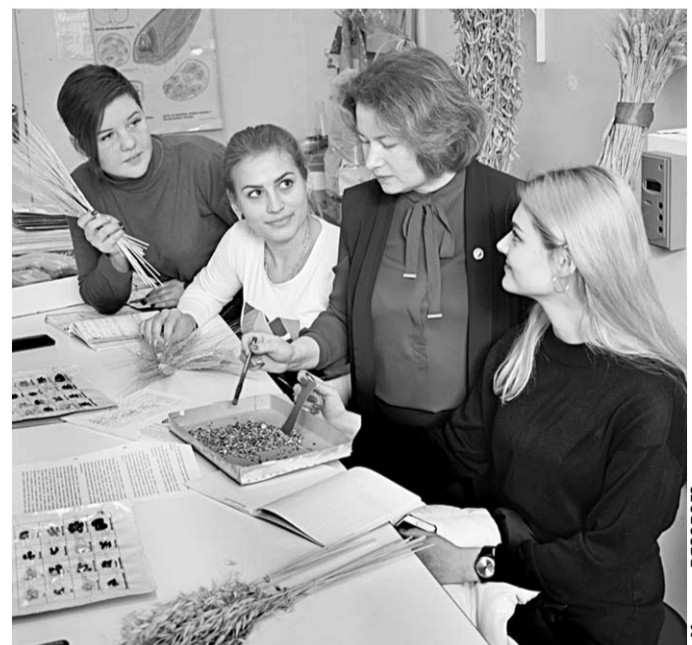
Тема занятий в лаборатории – «Семенной контроль».