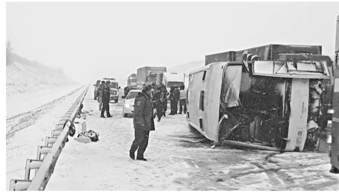
На месте резонансного ДТП.

Около 12 часов 30 минут 2 декабря в Богучарском районе 59-летний водитель междугороднего автобуса, следя по 763-му километру автодороги М-4 «Дон» в сторону города Родовая-на-Дону, не справился с управлением транспортного средства и допустил опрокидывание автобуса.