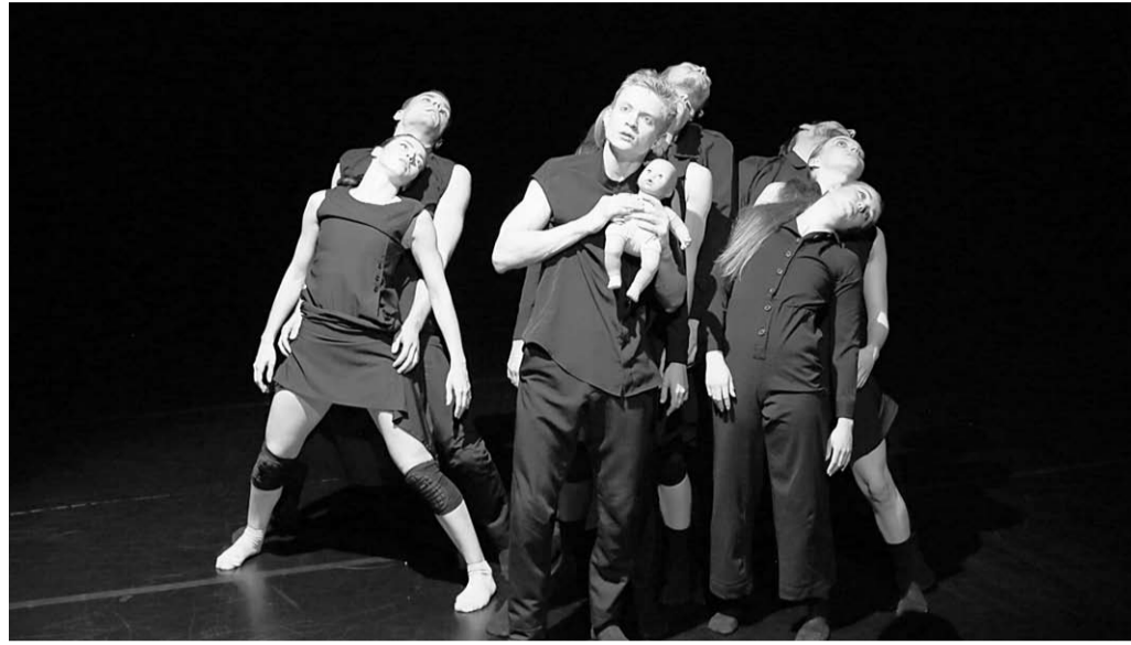
Сцена из спектакля «Зеркало».

Билет на балет | На сцене Воронежского Камерного театра – пластический спектакль о том, как человек отражается в окружающем мире