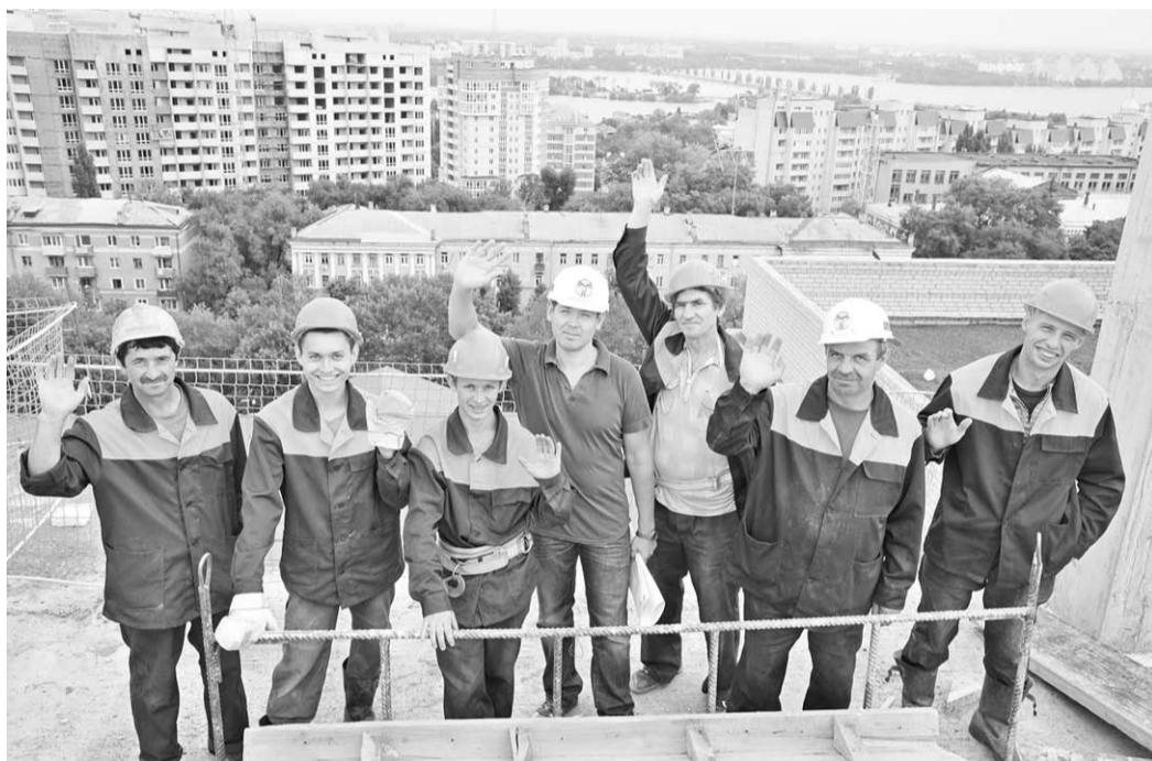
Без строителей не могли бы реализовываться наши социальные проекты. Вы возводите школы и больницы, физкультурные комплексы и объекты газификации. Желаем вам счастья, здоровья, благополучия в семьях. И, конечно же, новых успехов в работе на благо воронежского края.