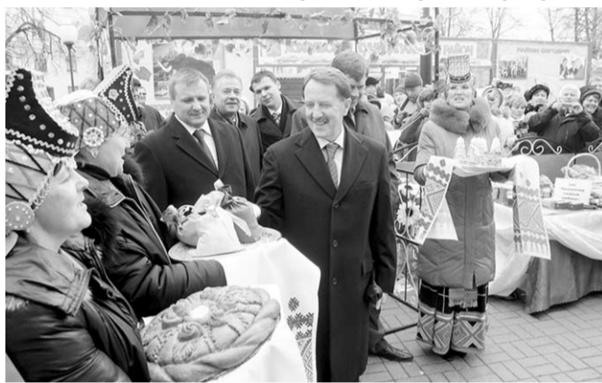
Труженики села приветствовали губернатора душевными караваемыми.

- Надо сказать, что наступил новый этап: в селах пора создавать социальную инфраструктуру, менять уклад, делать его современным. Тогда и молодёжь не будет уезжать в города, - отметил Алексей Гордеев.