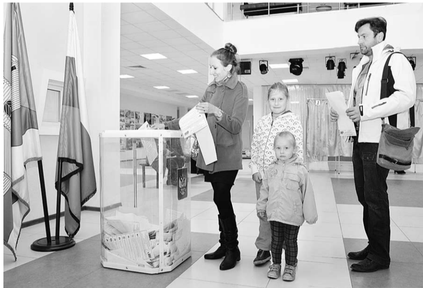
В минувшее воскресенье жители улиц Ленина, Восьмого марта, Авдеева, Крупской и Юбилейной села Новая Усмьня пришли на избирательный участок № 23/01, чтобы проголосовать за кандидатов в депутаты Государственной думы РФ седьмого созыва. Многие – с детьми.

18 сентября в Воронежской области прошли выборы депутатов Госдумы ФС РФ седьмого созыва