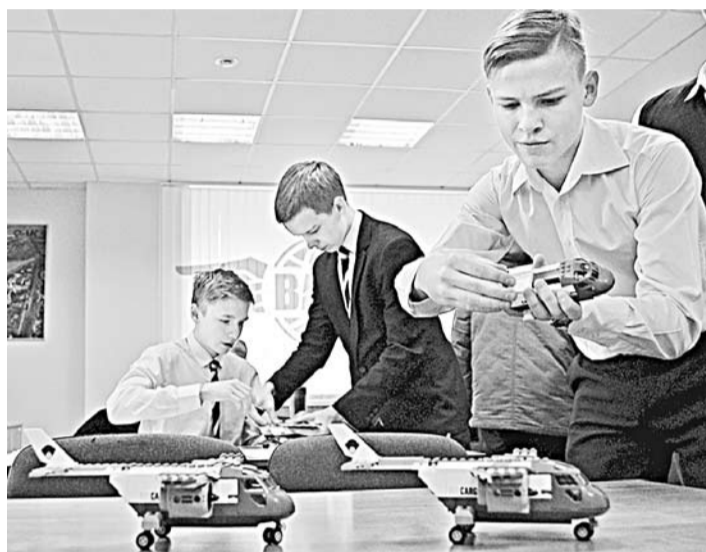
Школьники собирают самолёт.

В Воронеже, на площадке ВАСО, прошёл День Объединённой авиастроительной корпорации