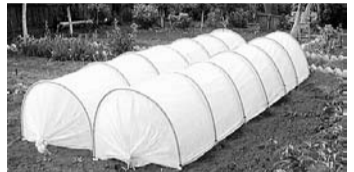
Вес всего 2 кг. Срок службы 3-5 лет

* Готовый парник с дышащим укрывным материалом СУФ-42 * В парнике создается идеальный климат для растений * Защищает растения от солнца, ветра, заморозков * Растения могут находиться без полива до 5 дней * Позволяет собирать 2-3 урожая за сезон, а зелень до 5 раз