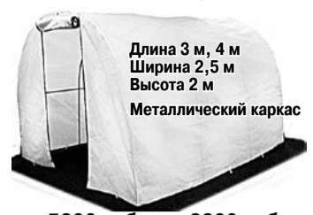
Длина 3 м, 4 м Ширина 2,5 м Высота 2 м Металлический каркас

В России разработали теплицу, в которой урожайность повышается в 2-3 раза. Овощи в ней не выгорают, нет необходимости в поливе и проветривании в отличие от обычных теплиц. А стоимость её в 4-5 раз ниже теплиц из поликарбоната. Начало сезона уже близко, торопитесь приобрести чудо-теплицы и другие уникальные товары, облегчающие работу в саду, на выставке-продаже от производителя.