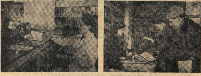
Вчера в магазинах Воронежа началось оживлённая торговля по новым ценам.