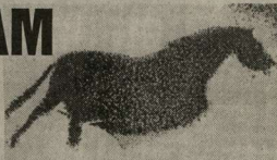
Вот такой наскальный рисунок «Белая лошадь» обнаружен в древнем саятчище в Хакасии.

В Хакасии мы открыли уникальное саятчище, возраст которого около 18 тысяч лет. На вершине красноцветной скалы изображена лошадь — мы назвали ее Белой, поскольку она напоминает белую аппликацию на красном фоне. Судя по всему, это дикая лошадь Пржевальского, короткое сильное туловище, огромное отвисшее брюхо... Мы обратили внимание, что к юго-востоку от площадки стоят весьма эффектные горы, которые местное население называет Сундукми. Их вершины точно определяют точки восхода Солнца в дни зимнего солнцестояния и точки появления полной лунной Луны... Другой пример выкопанного рисунка древней цивилизации народов Сибири — знаменитая Мальта под Иркутском. Принято