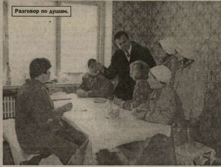
Разговор по душам.