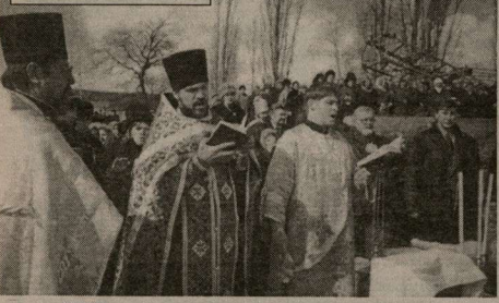
Освящение храма в Подгорном.