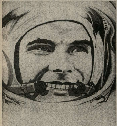
как прекрасна земля!