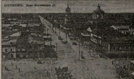
Воронеж, ул.Ново-Московская (ныне Плехановская).