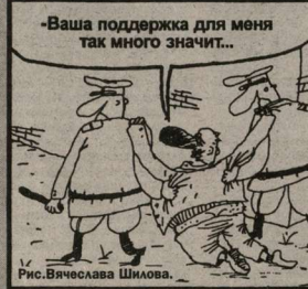
Рис. Вячеслава Шилова.

Некоторые средства массовой информации, действительно, сообщили о том, что Государственная Дума приняла поправку к Закону «О ветеранах», дающую право на звание ветерана труда всем лицам, не имеющим наград, при наличии у них вышеуказанного трудового стажа 40 (35) лет. Процедура принятия поправки весьма длительная: она может вступить в силу только после утверждения Советом Федерации, подписания Президентом и опубликования в «Российской газете». Поскольку не произошло, следовательно, отказ в