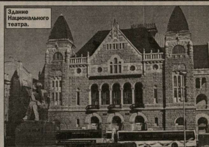
Здание Национального театра.