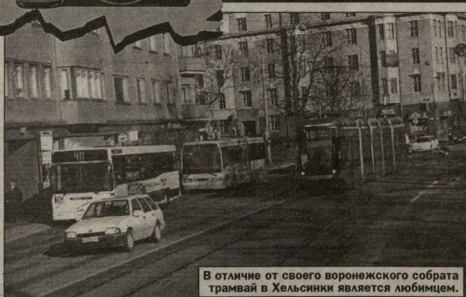
В отличие от своего воронежского собрата трамвай в Хельсинки является любимцем.