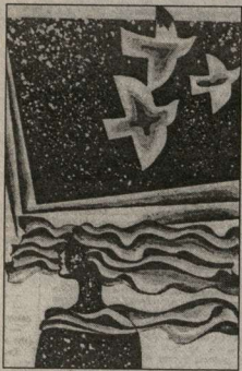
(Окончание. Начало в №16)

Более замуж уже не собиралась, хотя предложения были. И теперь при мизерной зарплате успевала и сделать репортажи, и продукты домой принести, и еду готовить, и даже воду из колонок в ведрах накатать, а зимой еще и горы снега убрать от двери.