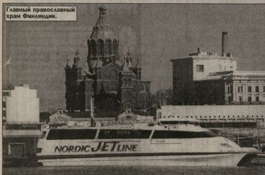
Главный православный храм Финляндии.