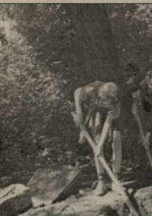
Учитель истории и его ученики единственными оставшиеся в неизменной судьбе Тернового кладбища.