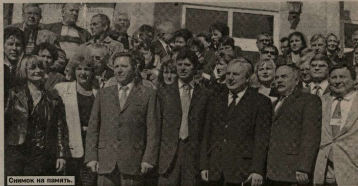
Снимок на память.