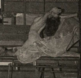
«Нет новости печальнее на свете»

куклы в тазике, совершенно тонут в потоке малоразумительного текста. Главная мысль, конечно, выписывается в конце концов: заботу близких о нас мы ценим только тогда, когда расстаемся с ними, но, право же, об этом можно рассказать более простым и доходчивым языком. А главное, сделать более органичным существование кукол в спектакле.