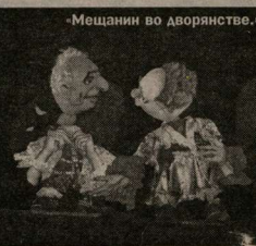
«Мещанин во дворянство»