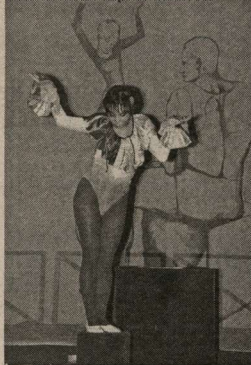
«По мотивам картин Пикассо»

Когда смотрела фестивальную афишу, поражаюсь смелости некоторых театров, включивших в репертуар Мольера и Шекспира, Гофмана и Уильяма. Так не терпелось это увидеть! Гофману, конечно, самое место в театре кукол, но как решить его средствами психологической драмы Уильяма?