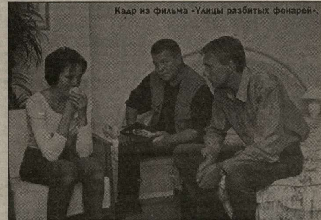
Кадр из фильма «Улицы разбитых фонарей».