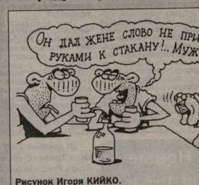
Рисунки Игоря Кийко.

Я являюсь инвалидом II группы с детства вследствие ранения и контузии, связанных с боевыми действиями в период Великой Отечественной войны. Прошу ответить на вопрос: положена ли мне надбавка к пенсии?