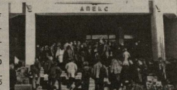
ВСЕ УСЛУГИ ЦЕНТРА БЕСПЛАТНЫ!