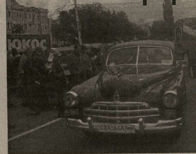
Милые девушки-модели всего за несколько часов бесплатно раздали 1200 атласов автомобильных дорог, которые выпустила компания ЮКОС.

Если вам довелось побывать в эти выходные на центральной площади Воронежа, то вы, наверняка, заметили – самое интересное происходило именно здесь: большой спортивный праздник, молодежная развлекательная программа, выставки, концерты, дискотека. Однако среди всего этого множества ярких и веселых мероприятий одно отличалось особенно, и многие со мной согласятся. Впечатляющее зрелище – па-