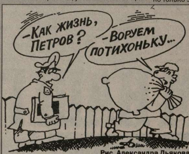
Рис. Александра Дьякова

Пособие исчисляется из фактического заработка за педагогическую работу по всем местам работы, установленного при