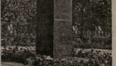
Памятник Льву Николаевичу Толстому на станции, названной его именем.

Официальные органы печати, травившие Толстого, вдруг приспоились «любовью» к писателю.