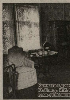
Комната в доме начальника станции Астапово Ю.В.Влчд. И.И.Изолина. Здесь прошли последние семь дней жизни Льва Николаевича Толстого.

— Варочка — хорошая сиделка... Только женщины могут так ухаживать.