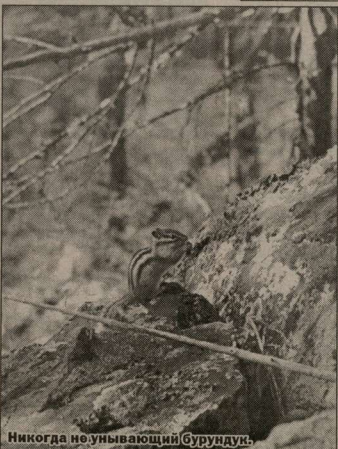
Никогда не унывающий бурдунок.

Итак – пятнадцать лет, поэтому никто всерьез его клятву не воспринимал. Рабочие... Ну, это особый народ! В большинстве своем они из заключенных, отсидевших разные сроки – от пяти до пятнадцати лет. Были и сбегавшие из тюрьмы, прибывшие к геологической партии. Больше в тайге некуда.