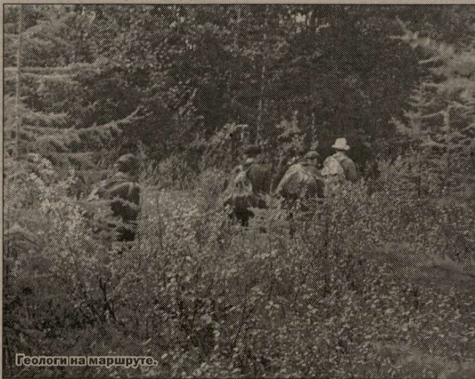
Геологи на маршруте.

Дни проходят за днями, на корточках привалах, Собирая палатки, мы уходим в маршрут. А когда, дорогая, ляжет снег на вершинах, Мы вернемся обратно, в свой родной институт.