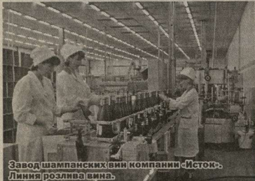
Завод шампанских вин компании «Исток». Линия розлива вина.