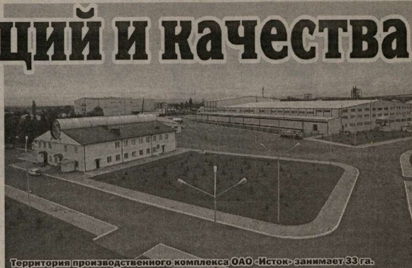
Территория производственного комплекса ОАО «Исток» занимает 33 га.

Полностью автоматизированные заводы компании представляют собой образец научно-технической мысли и позволяют осуществлять непрерывный контроль за качеством напитков на каждом этапе их производства. Достаточно сказать, что внутренние стандарты качества, используемые в компании «Исток» при изготовлении высококачественного спирта, в три раза жестче ГОСТовских, и, по оценке НИИ пищевой и перера-