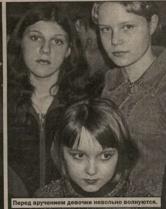
Перед вручением девочки невольно волнуется.