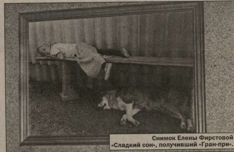
Снимок Елены Фирстовой «Сладкий сон», получивший «Гран-при».

Прошло время. Итоги были подведены, и 35 победивших фоторабот 20 декабря были вывешены в красивых рамках в фойе кинотеатра «Юность». В десять часов начался праздник: игры, конкурсы, театрализованные представления – все это