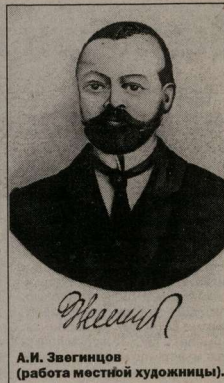
А.И. Звегинцов (работа местной художницы).

иннам, погибшим от ран в 1941-1945 годах. На обелиске надписи: «Вечная память, вечный покой».