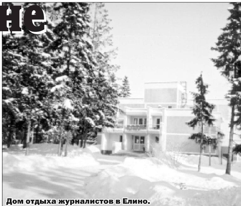
Дом отдыха журналистов в Елино.

К услугам отдыхающих были предоставлены различные развлекательные и познавательные программы, проводились соревнования по шахматам, выявлялись мастера бильярда.