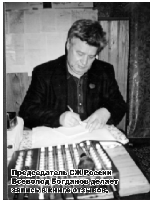
Председатель СЖР России Всеволод Богданов делает запись в книге отзывов.

Практически эту акцию нельзя назвать только отдыхом, ведь каждый день шли полезные занятия, творческая работа, встречи с известными людьми страны, поездки.